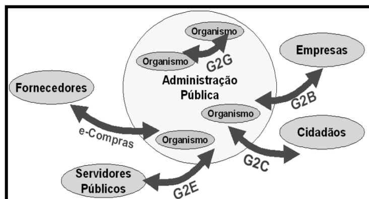
Figura 1: Organismo governamental e suas inter-relações.

Nesse aspecto, é comum a utilização de modelos de maturidade para programas de e-gov , no intuito de se determinar o nível de desenvolvimento do ente governamental na condução dos processos de utilização das tecnologias da informação e comunicação (LAIA, 2009). A empresa Accenture (2003), apresenta um modelo que aborda o progresso do e-gov a partir de cinco dimensões que caracterizam estágios de desenvolvimento, iniciando em presença online, capacidade básica, disponibilidade de serviços e maturidade na entrega, até alcançar a transformação dos serviços, tendo como foco o cidadão (ACCENTURE, 2003).