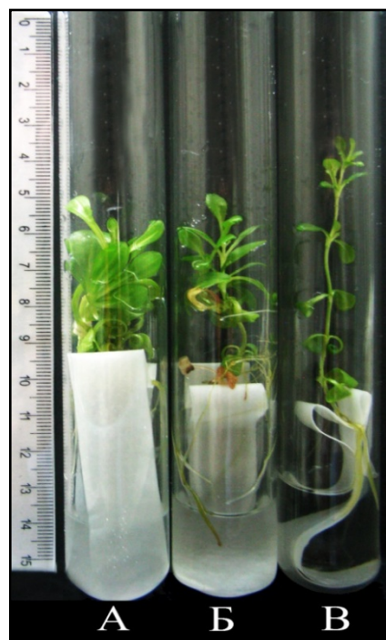
Рис. 1. Зміна габітусу культивованих in vitro рослин G. lutea популяції г. Шешул-Павлик за різних світлових режимів їх вирощування: А – другий варіант світлової корекції; Б – перший варіант світлової корекції; В – контроль

витку листової поверхні (LAR). Відмінність контрольних рослин достовірно не значна лише від параметра SLA рослин першого варіанта СК (у випадку г. Пожизевська та г. Шешул-Павлик); за іншими параметрами рослини контрольної групи статистично достовірно ( P < 0,001 ) відрізняються від обох варіантів досліді.