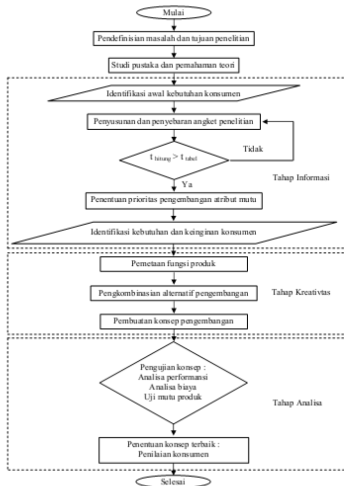
Gambar 1. Diagram Alir Penelitian

Jadi jumlah sampel yang diambil untuk dijadikan sebagai responden adalah 100 responden.