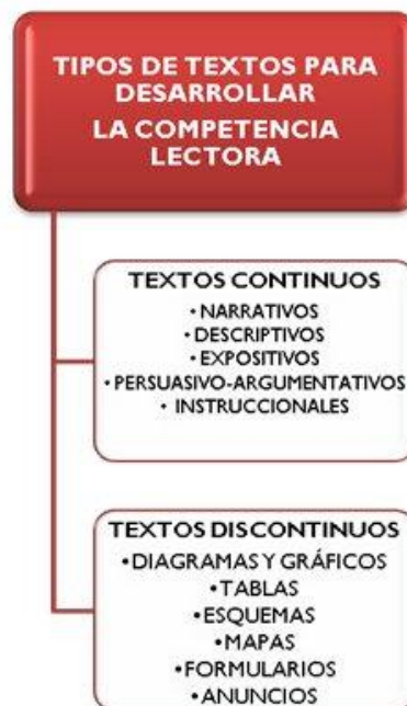
Gráfico III. Tipologías textuales

En cuanto a los tipos de texto, vid, Gráfico III :