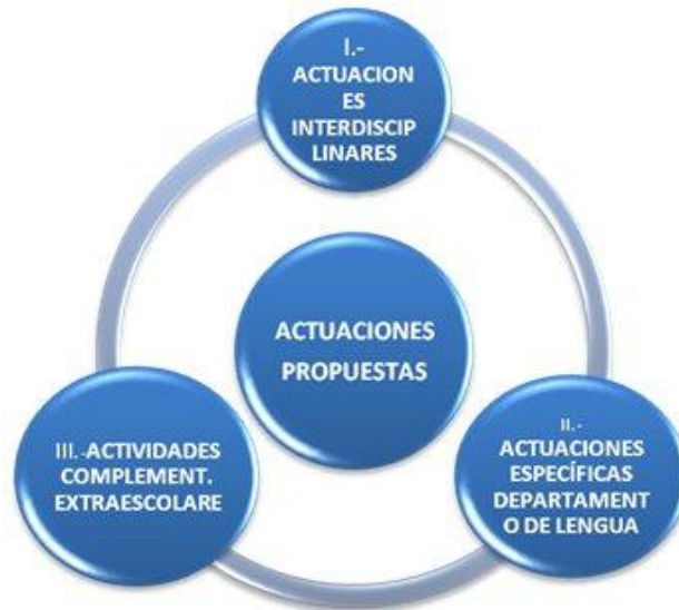
Grafico 1. Actuaciones de mejora propuestas