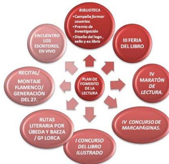
Gráfico V. Actividades complementarias y extraescolares