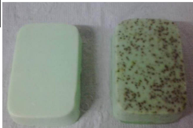
Figura 1. a) base glicerificada; b) sabonete esfoliante

A Figura 1 ilustra o sabonete em barra desenvolvido com o co-produto do processamento das azeitonas de mesa.