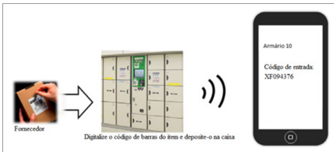
Figura 1 - Uso da tecnologia da informação para entrega de materiais

os custos crescentes e satisfazer as expectativas de qualidade. Esses conceitos visam dar visibilidade do inventário para fornecedores, reduzindo a incerteza, os prazos e a necessidade de segurança, o que resulta em práticas de cadeia de suprimento mais rentáveis, como o just-in-time . Outro tema abordado foi o o processo de reengenharia com a utilização de novas tecnologias de informação e comunicação (TIC), tais como codificação de barras e identificação por radiofrequência. O objetivo foi que fornecedores fizessem entregas diretas para unidades de cuidados com o paciente. Para tanto, apresentou-se o conceito de um banco de armários eletrônicos. Cada banco de armários compreende numerosas caixas seguras, equipadas com comunicações sem fio (3G) para notificação das entregas confirmadas aos destinatários. Eles são tipicamente operados e mantidos pelo fornecedor e situados em locais centrais. Essas caixas são apenas um meio de detenção temporária de ações (máximo de um dia), informando ao pessoal que uma encomenda específica está pronta a recolher. A caixa de armários envia uma mensagem para a placa de switch do hospital que a transmite, juntamente com os códigos de segurança, através do sistema de telefonia, conforme Figura 1. Essa solução permite aumento da velocidade e qualidade dos cuidados com a saúde.