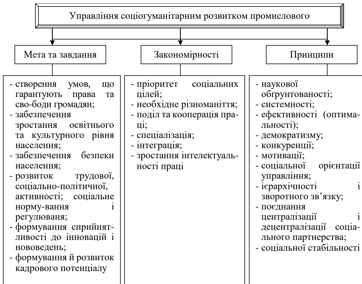
Рисунок 2. Структура категорії «управління соціогуманітарним розвитком промислового підприємства та розвитком трудового колективу»