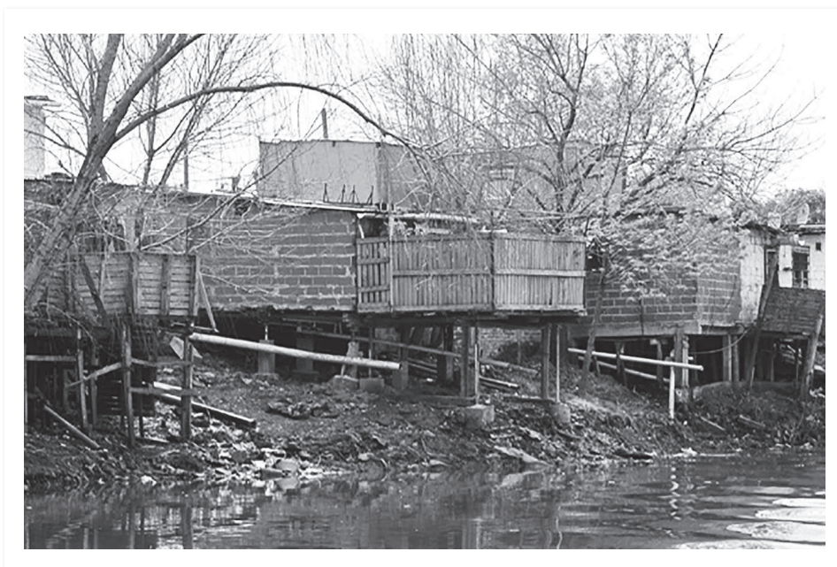
Viviendas de la villa 21-24 sobre el margen del Riachuelo

En la ciudad de Buenos Aires, fue el Instituto de Vivienda de la Ciudad (IVC), a instancias de los dictados de la Corte Suprema y del juez Armella, el responsable de realizar un estado de situación de la ocupación del camino de sirga y determinar la población que iba a ser relocalizada. Su relevamiento estableció la existencia de seis barrios “obstructivos” sobre los que se debía intervenir para dar cumplimiento a la sentencia judicial: El Pueblito, Luján, Magaldi, Lamadrid, la villa 26 y la villa 21-24, a los que se suman familias dispersas a lo largo de la ribera denominados por el IVC “suelitos”. Al día de la fecha —cinco años después de iniciado el proceso— solo ha finalizado la relocalización de los habitantes de los primeros tres asentamientos y las escasas familias dispersas.