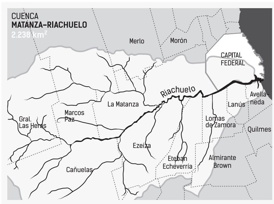
Mapa de la cuenca Matanza-Riachuelo.

El caso se mantuvo abierto, y mediante audiencias públicas el plan se fue construyendo de forma progresiva, a cargo de un nuevo ente interjurisdiccional que desde el año 2007 tiene la competencia sobre las acciones para la recomposición de la cuenca: la Autoridad de la Cuenca Matanza-Riachuelo (ACUMAR) 4 . En julio de 2008 la Corte dictó sentencia por recomposición y prevención, definió mandatos de cumplimiento obligatorio para la administración pública y generó un mecanismo de ejecución de la sentencia que recayó en un juzgado de primera instancia.