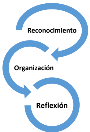
Figura 1. Representación de la fase de indagación diagnóstica del GET

Los investigadores, al hacer parte del cuerpo docente de la Institución Educativa Rafael Núñez y atendiendo lo que por observación directa se apreciaba, así como los resultados académicos y las correspondientes discusiones generadas en cuanto a las formas de orientar las clases; pudieron determinar que existía una problemática en cuanto a las prácticas de lectura en la escuela. Asimismo, se pudo plantear la posibilidad de relación existente entre las prácticas de lectura y el escaso hábito lector de los estudiantes de básica primaria. Luego de varias sesiones se obtiene como resultado que al generar prácticas de lectura aisladas, disfuncionales y tradicionales no se habían podido mejorar los resultados en los estudiantes desde la perspectiva de comprensión lectora, y mucho menos, que fomentaran el deseo por la lectura.