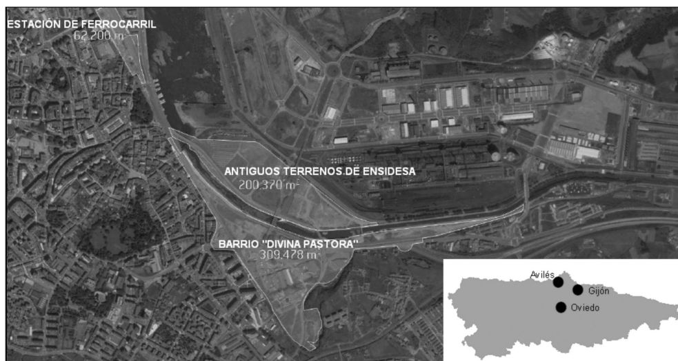
Figura 3 ÁREA DE PLANEAMIENTO REMITIDO: NUEVA CENTRALIDAD