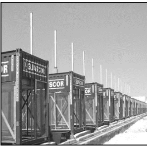
Figura 3. Grupo electrógeno de la CTM “Máximo Gómez” (2015).

Medios: planos, herramientas, materiales y aparatos de medición.