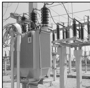
Figura 2. Subestación eléctrica de la CTM “Máximo Gómez”, municipio Mariel (2015).

Medios: planos, herramientas, materiales y aparatos de medición.