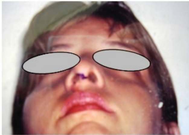
Figura 8. Se observa incisión en escalón.