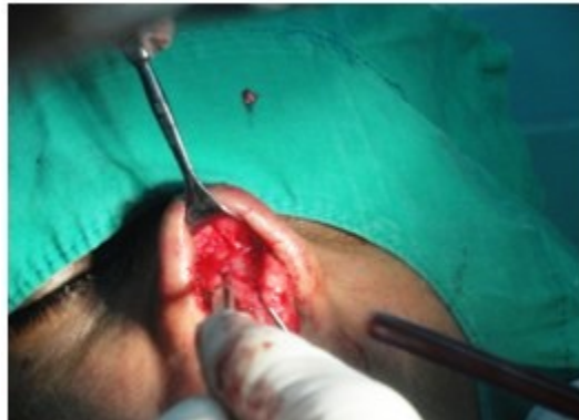
Figura 2. Se avanza exponiendo la estructura anatómica hasta la mitad del ala nasal.