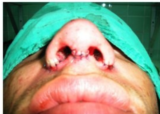
Figura 4. Se observa la sutura en base de la columela y alas nasales para estrechamiento de las narinas.

Las imágenes y datos han sido utilizados previo consentimiento informado a los pacientes. Para la realización del estudio se contó con la aprobación del Consejo Científico de la Institución.