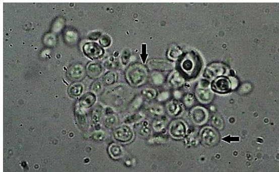
شکل ۵) عدم تشکیل لوله زایای کاندیدا/آلبیکنس تیمارشده با ۵۰ میکرولیتر ایتورین A پس از ۲/۵ ساعت انکوباسیون در سرم خون

با وجود نتایج منفی چاهک‌گذاری برای قارچ‌های مخمری به‌منظور کنترل بیشتر، میزان MIC و MFC برای قارچ‌های مخمری کاندیدا انجام شد. نتایج به‌دست آمده، رشد قارچ در تمامی لوله‌ها و رقت‌های لیپوپپتید را نشان داد، به‌طوری که در تمام لوله‌ها (مشابه لوله شاهد منفی فاقد ماده ایتورین A) رسوب مشاهده شد، که پس از تکان دادن لوله‌ها کدورت ایجاد شد. براساس نتایج به‌دست آمده از تعیین مقدار MFC در هیچ‌یک از رقت‌های لیپوپپتید استخراجی مهار رشد گونه‌های مخمری کاندیدا مشاهده نشد.