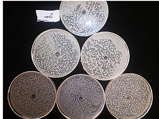
شکل ۱) رشد پنج گونه قارچ کاندیدا در برابر متابولیت‌های استخراج شده در مقایسه با شاهد منفی (چاهک)

مولکول ایتورین با تشکیل کمپلکس ایتورین- فسفولیپید- استرول نفوذپذیری لیپیدی غشای سلول‌های قارچ را توسط تشکیل منافذ یونی افزایش داده و ابتدا باعث نشت یون‌های پتاسیم و سپس ترکیبات ماکرومولکولی ضروری سلول می‌شود [23-25]. ایتورین، اسپوره‌های قارچ مخمری و کپکی را نیز نفوذپذیر کرده و لوله زایای قارچ هنگام جوانه‌زنی را مهار می‌کند [18، 19]. ترکیب لیپوپپتیدی مایکوسوبتیلین و ترکیب مشابه باسیلوماپسین D (از خانواده ایتورین‌ها) جداسازی شده از باسیلوس سوبتیلیس، توانایی مهار گونه‌های مختلف کاندیدا را نشان داده است [26، 27]. در مطالعه