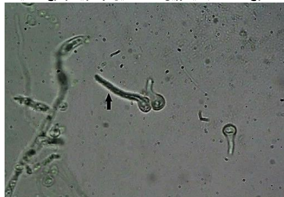
شکل ۳) تشکیل لوله زایای قارچ کاندیدا/آلبیکنس پس از ۲/۵ ساعت انکوباسیون در سرم خون (شاهد)

کاندیدا/آلبیکنس قادر به تشکیل لوله زایا پس از ۲/۵ ساعت انکوباسیون در سرم خون فاقد ایتورین A یا فاقد متابولیت استخراج شده از باکتری بود (شکل ۳)، اما ترکیب لیپوپپتیدی استخراج شده مشابه ایتورین A، تشکیل لوله زایا در قارچ کاندیدا