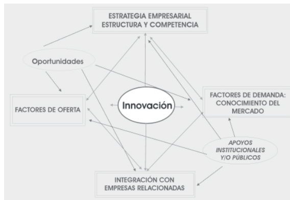
Figura 3. El Diamante de la competitividad. Fuente: Porter, 1990.

La competitividad de las naciones, se logra a través de la competitividad de sus empresas, la cual es descrita de la siguiente forma: