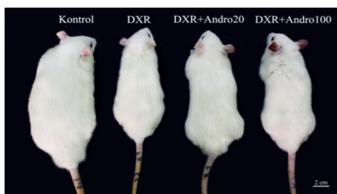
Gambar 1 Perbandingan ukuran tubuh tikus

Perbedaan huruf superscript pada baris yang sama menunjukkan perbedaan signifikan ( p < 0.05 ; n = 6 ).