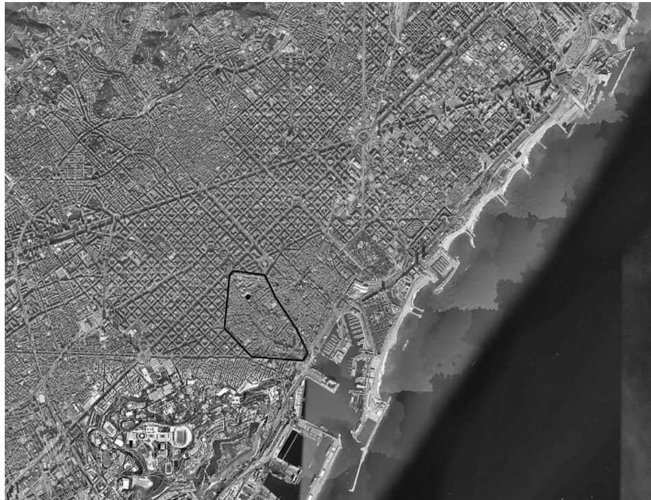
1- Foto aérea de Barcelona con el barrio de Raval y la ubicación de la plaza.

CUADERNO URBANO. Espacio, Cultura, Sociedad – VOL. 8 – Nº 8 (Octubre 2009) pp. 137-158. ISSN 1666-6186