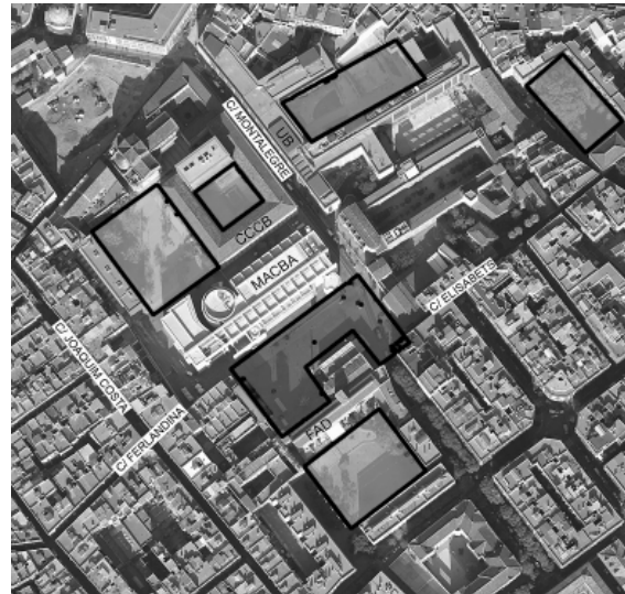
7. Calles, edificios principales y plazas vecinas.

Finalmente, otras cuestiones están relacionadas con el carácter y la vitalidad de este espacio. ¿De qué otras maneras es utilizado? ¿Qué otros grupos de personas acoge? ¿Cómo se organizan las diversas actividades y sub-ámbitos? ¿Qué consecuencias tiene dicha actividad para el propio espacio y para el conjunto del barrio?