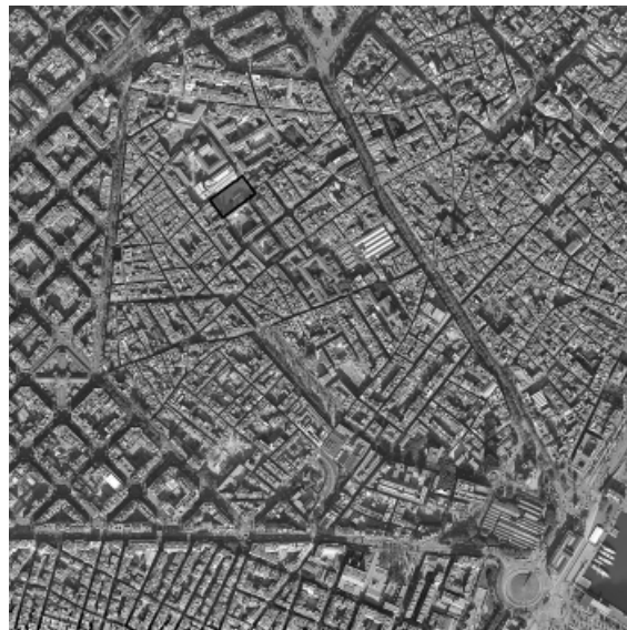
2- Detalle barrio de Raval con la ubicación de la plaza.

4- Cabe resaltar que este estudio de caso es parte de una investigación doctoral cuyo marco conceptual conforma un apartado específico, y que fundamenta de forma profunda todas las elecciones de casos de análisis. No obstante, como método de análisis de campo se adoptó la mirada empírica como forma de aproximación a través de experiencias prácticas.