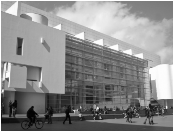
9. La presencia del Museo en la plaza.

El skateboarding , como actividad en buena medida espontánea, suele explorar y ocupar un determinado espacio físico, descubriendo en tantas ocasiones posibilidades bien diferentes de las aquellas para las cuales el espacio fue creado (BORDEN, 2001). Independientemente de la idea que dio origen al proyecto ¿qué es lo primero que nos