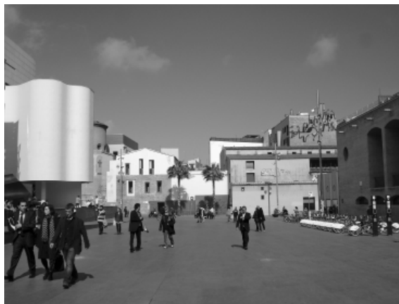
8. Plaza contenida entre edificaciones de gran porte.