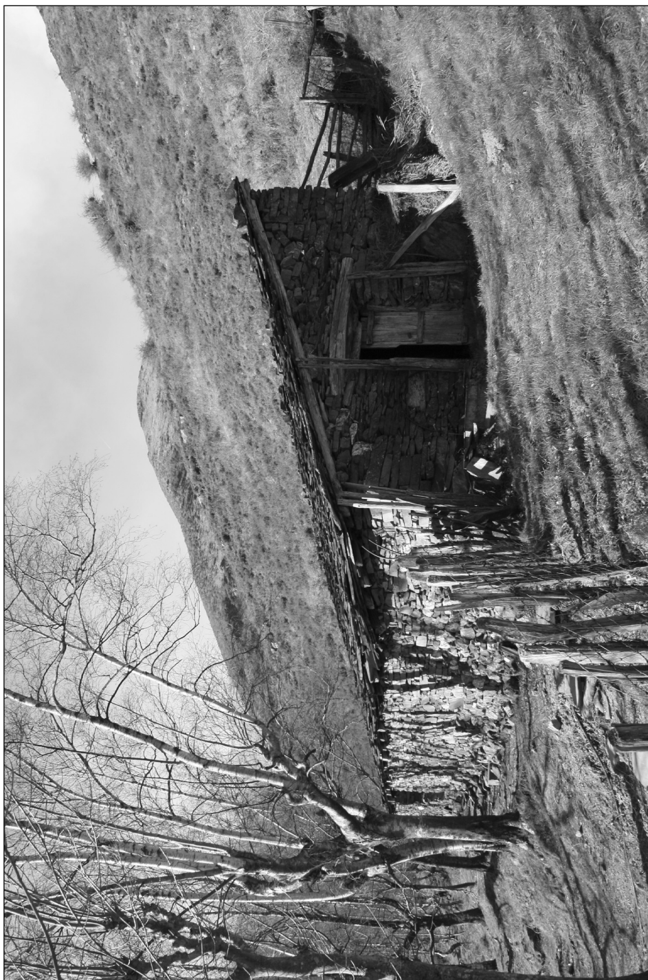
Borda honetxen sorrerak piztu zuen 1795eko auzia