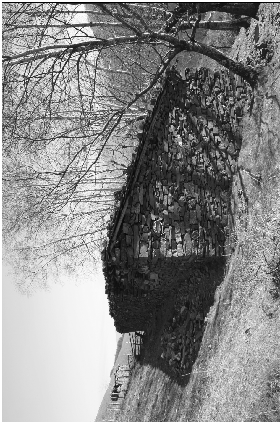
Gorreneko borda, guxi bezala, isuri bakarreko teiltuarekin