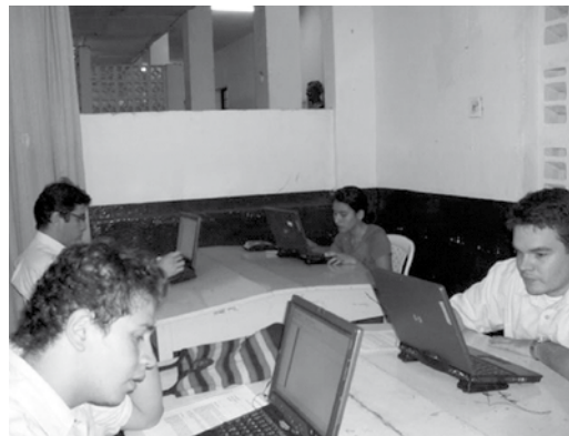
Figura 5. Maratón de programación periodo 2009-1.

El evento tuvo lugar en el aula de dibujo. Esto permitió la motivación de los estudiantes, una mejor organización del aula y de las condiciones en las que los participantes contaban para la realización de sus programas [ver figura 5].