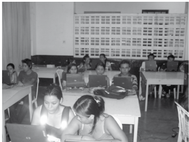
Figura 1. Grupo de TINF periodo 2009-1.

Con algunas dificultades de tipo tecnológico, como lo fue accesibilidad a la red inalámbrica, configuración de los equipos de acuerdo a las necesidades de la regional, ya que no se contaba con permisos de administrador para los cambios entre otros, se llevó a cabo la implementación de la prueba piloto del proyecto, obteniendo como resultados una