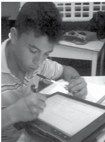
Figura 4. Realización clase de pre-cálculo grupo ICIV 2009-2.

los apuntes en papel, para la interacción total sobre la pizarra, empleando Journal como principal editor para los estudiantes; las reuniones eran semanales y al ser un programa con mayor población estudiantil, se trabajaba en grupos, de tal forma, que se rotara el empleo del Tablet PC.