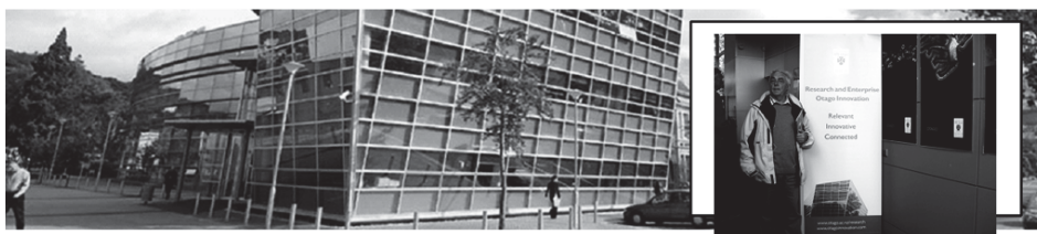
Rys. 1. Centra innowacji Uniwersytetu Otago