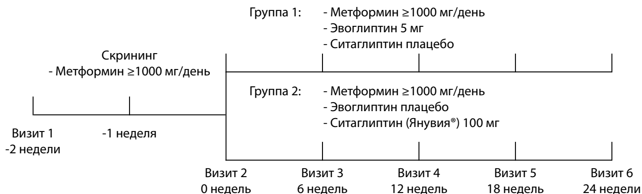
Рис. 1. Схема проведения исследования.

и женщины в возрасте от 18 лет с подтвержденным диагнозом СД2, (3) с уровнем гликированного гемоглобина на скрининге в пределах 6,5–11,0%, (4) получающие монотерапию метформинном в дозе не менее 1000 мг в сутки как минимум в течение 3 мес и последние 6 нед до скрининга, (5) ИМТ которых во время скрининга находился в пределах 20–40 кг/м 2 ; (6) все пациенты подписали согласие придерживаться барьерных методов контрацепции с момента подписания информированного добровольного согласия до окончания участия в исследовании.