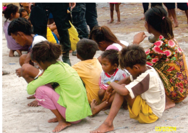
Gambar. 1: Kondisi anak dan orang tuanya ketika berada dalam penampungan di lapangan Bulalung, Kecamatan Derawan, Kampung Tanjung

Manusia perahu mencari ikan di perairan Indonesia hanya untuk mencari kehidupannya, bukan untuk berniat mencari keuntungan yang besar. Salah satu ciri ilegal fishing adalah tidak membawa serta perempuan dan anak-anak. Sedangkan manusia dalam kasus di Kabupaten Berau adalah membawa serta istri dan anak-anak mereka dalam perahu. Mereka kesehariannya hidup dan tinggal di perahu dan mengikuti arah angin tanpa memperdulikan keberadaannya sedang di negara mana. Sebenarnya komunitas ini pada dasarnya adalah cinta kedamaian. Berikut adalah gambaran kondisi manusia perahu saat berada di pengungsian dengan istri yang sedang hamil dan 5 orang anaknya.