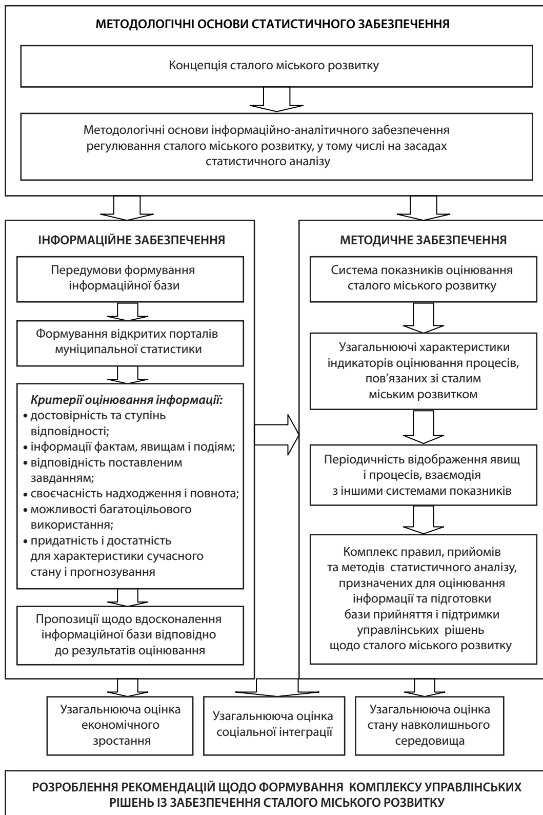
Рис. 3. Концептуальна блок-схема статистичного забезпечення управління сталим міським розвитком