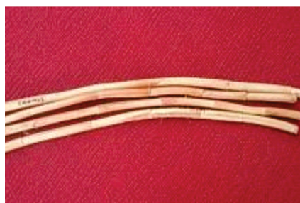
a. Calamus ( C. holttumii )

++) Lihat Lampiran 1 (refer to Appendix 1)