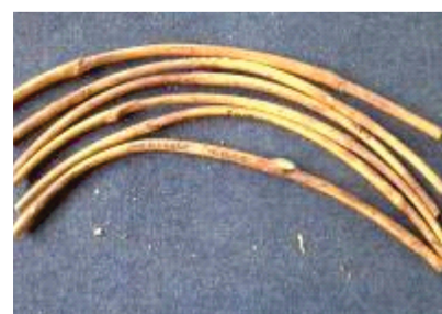
c. Cabang ( K. celebica )