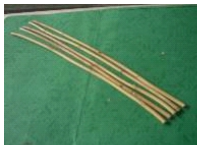
b. Mawang ( C. nematospadix )