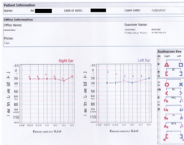
Gambar 1. Contoh Hasil Audiogram dengan Kategori Tuli Ringan