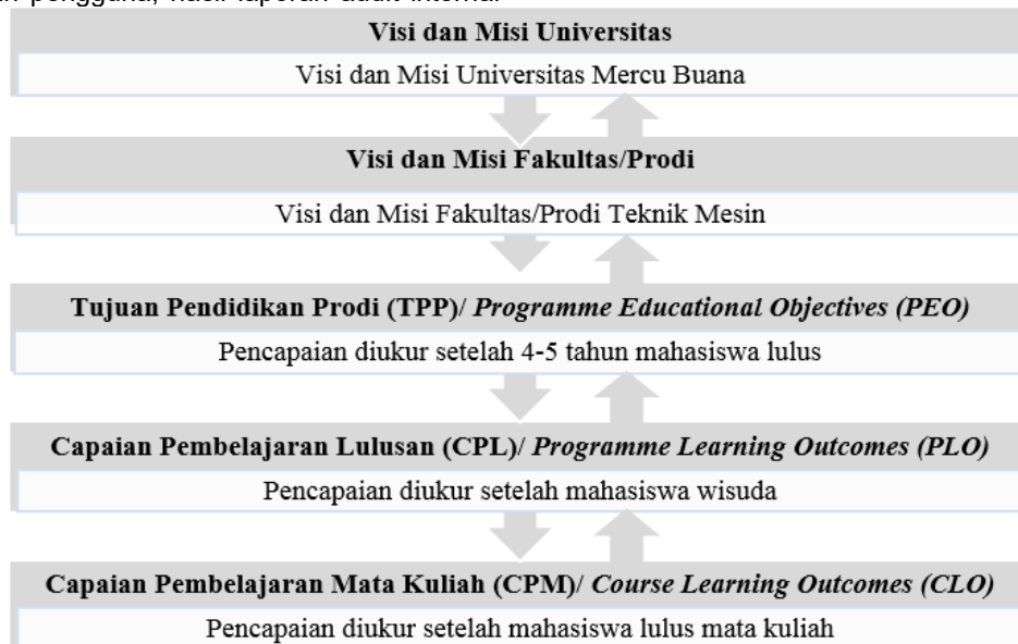
Gambar 3. Alur proses penyusunan kurikulum

Pada Gambar 3 di bawah ini menunjukkan alur proses penyusunan kurikulum dan pelaksanaan sistem pembelajaran. Alur dalam dua arah menunjukkan bahwa semua unsur saling berkaitan. Hal penting yang perlu diingat adalah setiap unsur memiliki kriteria dan harus bisa diukur pencapaiannya.