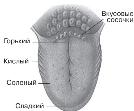
Рис. 1. Вкусовые зоны языка Fig. 1. Tongue taste zones

Механизм восприятия химических веществ нейроэпителиальными клетками вкусовых лукович продолжает изучаться. Восприятие соленого вкуса