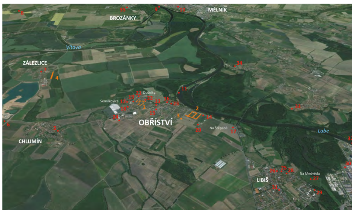
Pl. 3/1: Map of the Knovíz culture settlements in the microregion of interest; for descriptions of the individual items see Tab. 1 (the scale changes with the perspective).