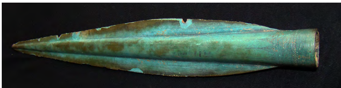
Pl. 2/1: Fotografie nalezeného hrotu kopí. Pl. 2/1: The Nesměň spearhead.