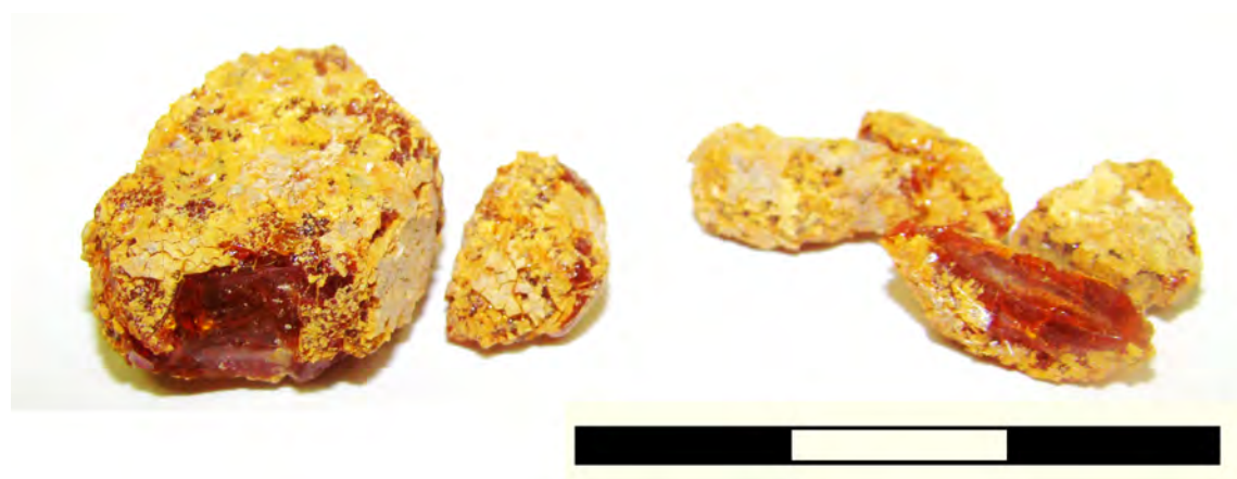
Pl. 3/2: Raw amber lumps from Obříství excavation 2011.