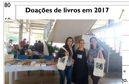
Figura 10 – Doações de livros da EdUFGD.

técnicos administrativos e docentes), através do programa de doações. Nota-se que durante a IV Feira do Livro e da Leitura da UFGD, realizada no dia 1º de agosto, o número de doações aumentou consideravelmente em relação aos meses anteriores. Observe as doações realizadas de acordo com as figuras 10 e 11: