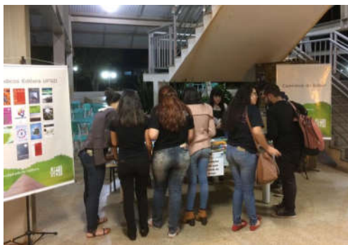
Figura 9 – Exposição e venda