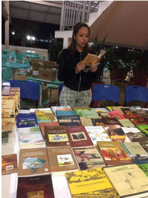
Figura 17 – leitura no Centro de Convivência