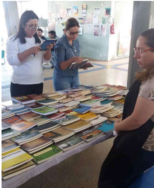
Figuras 7 e 8 – Exposição e vendas de livros.