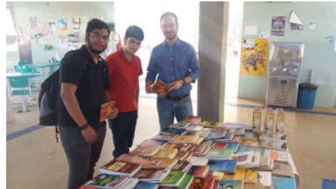
Figuras 5 e 6 – Exposição e vendas de livros no período vespertino.