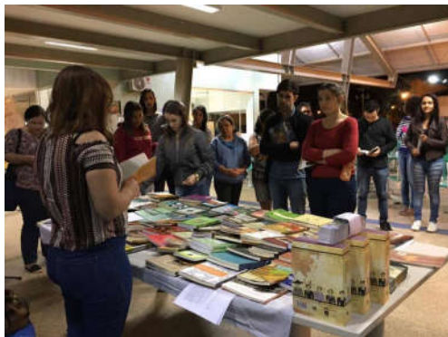
Figuras 18– Leitura no Centro de Convivência.