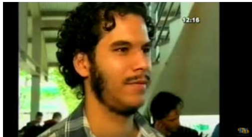
Figura 13 – Autor Matheus H. P. dos Santos.