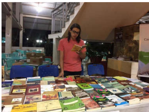
Figuras 18– Leitura no Centro de Convivência.