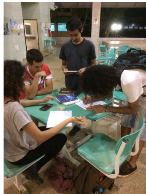
Figura 11 – Doação de livros.

Em seus depoimentos, acadêmicas que visitaram a IV Feira do Livro e da Leitura da UFGD, beneficiadas com a política de doação de livros, expõem suas impressões sobre o evento, como podemos ver a seguir: