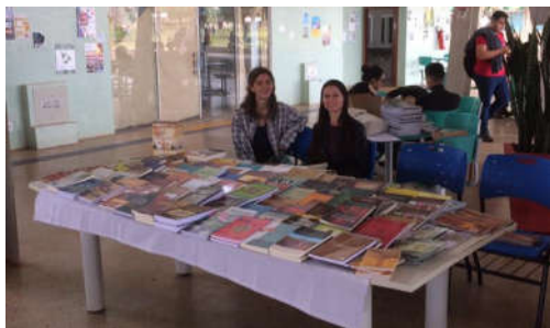
Figura 3 – Exposição e venda no período matutino.