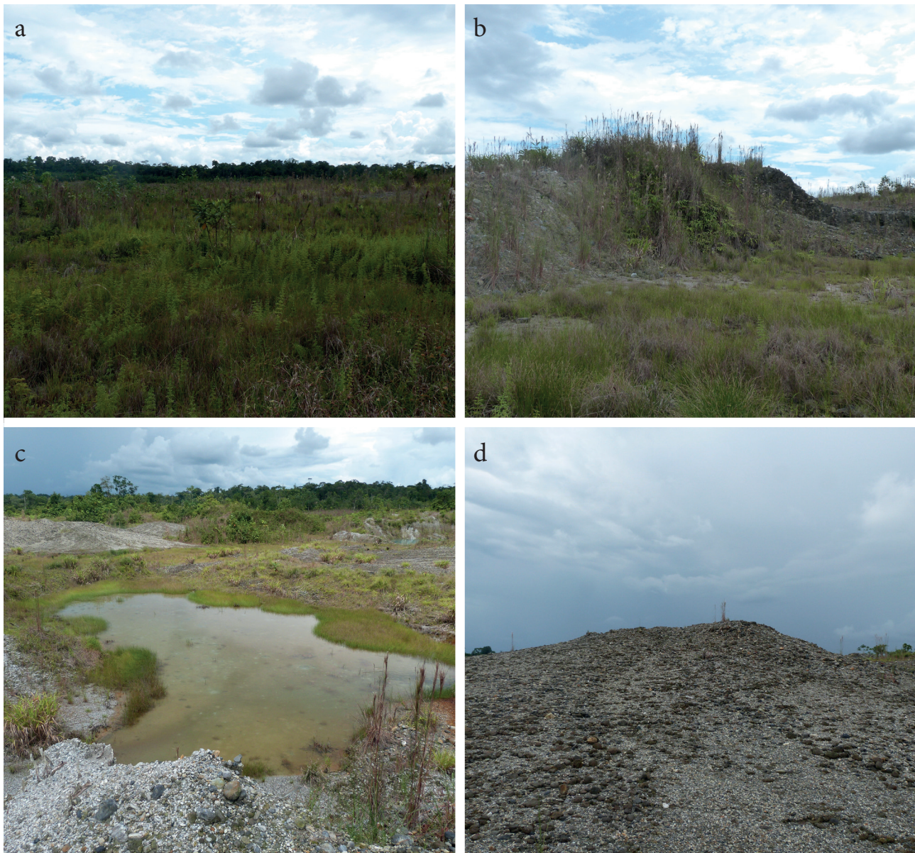
Figura 3. Principales formaciones topográficas resultantes de las labores de minería a cielo abierto en bosques naturales del Chocó, Colombia: a) zonas planas no inundables, b) taludes de pendiente fuerte, c) depresiones cenagosas o zonas pantanosas y d) montículos de arena y grava.

(Gentry 1996, Mahecha 1997), por confrontación con ejemplares depositados en los herbarios CHOCÓ de la Universidad Tecnológica del Chocó, Colecciones Científicas en Línea de la Universidad Nacional de Colombia con sede en Bogotá ( http://www.biovirtual.unal.edu.co/ICN/ ), Tropic del Missouri Botanical Garden ( http://www.tropicos.org ) y Virtual Herbarium del New York Botanical Garden ( http://www.nybg.org ).