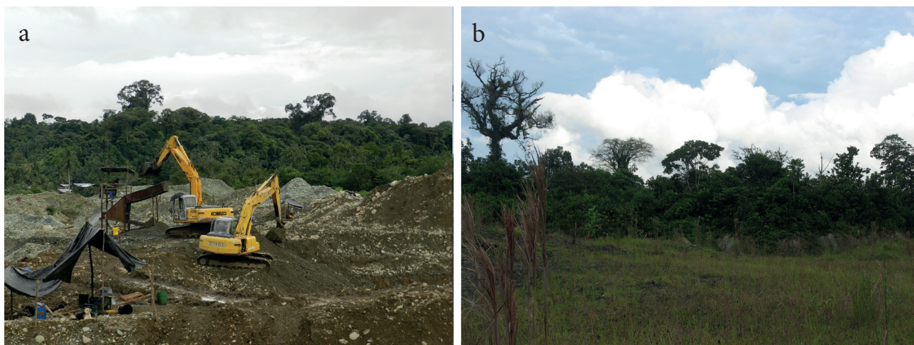
Figura 2. Minería a cielo abierto en el Chocó, Colombia: a) impactos generados por la actividad minera realizada con retroexcavadoras en el seno de los sistemas forestales naturales y b) capacidad de regeneración natural de los sistemas afectados.

En las minas seleccionadas se realizaron colecciones generales de las morfo-especies de plantas vasculares que caracterizan a estos sistemas durante dos años (entre marzo de 2012 y marzo de 2014), tomando nota de su hábito de crecimiento (herbáceo, arbustivo o arbóreo) y el sitio de la mina (hábitat) donde estas se encontraban creciendo (ecotono, taludes,