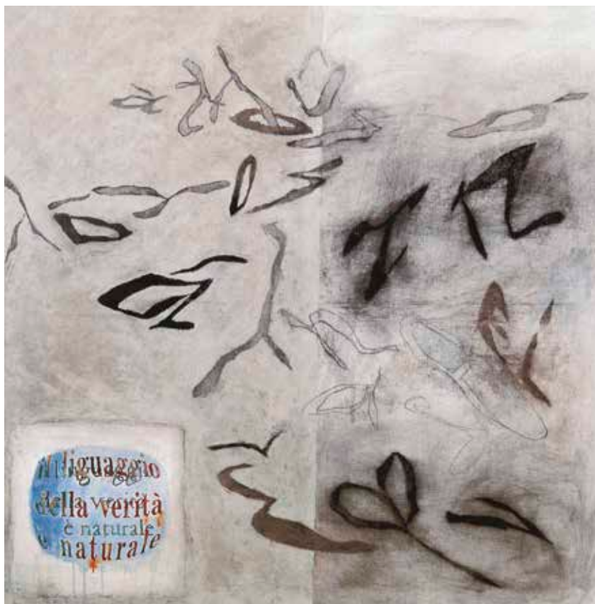
Figura 1. – Il linguaggio della verità è naturale, 1997.