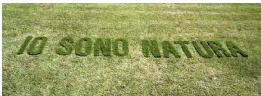
Figura 10. – Installazione IO SONO NATURA, Cartagine - Mangiaterra, 2012.