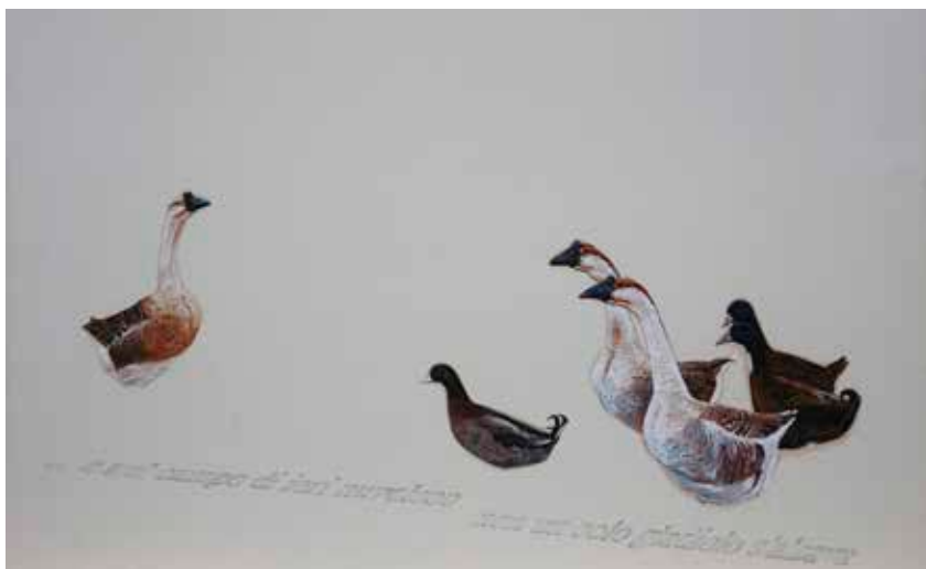
Figura 4. – Oca bianca, con versi di Umberto Piersanti, 2001.