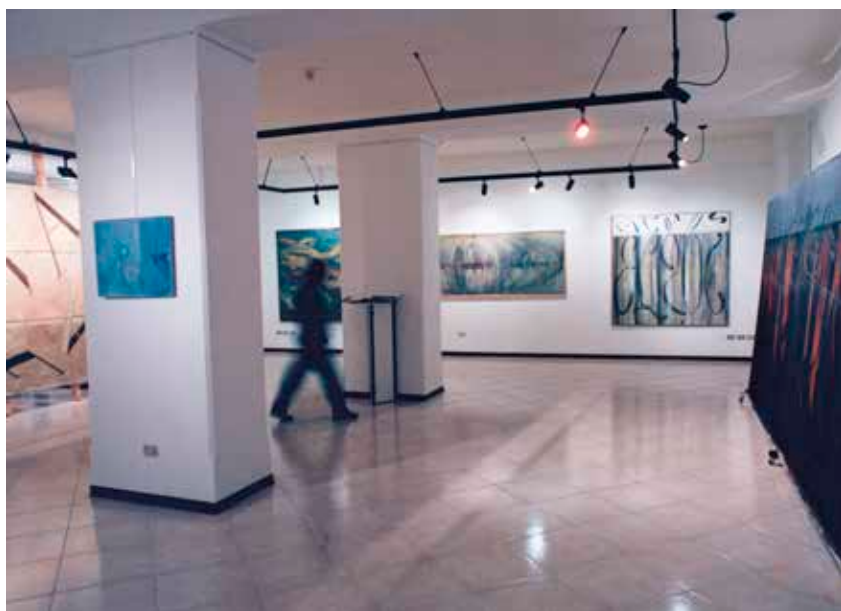
Figura 3. – Etica, installazione della mostra al Centro Nazionale di Studi Leopardiani, Recanati, 1989.