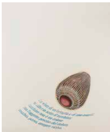
Figura 2. – Vaso con versi di Paolo Volponi, 2001.