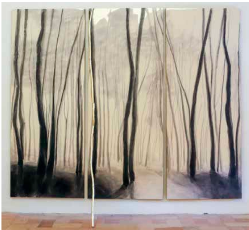
Figura 9. – Bosco-Polis, 2018.