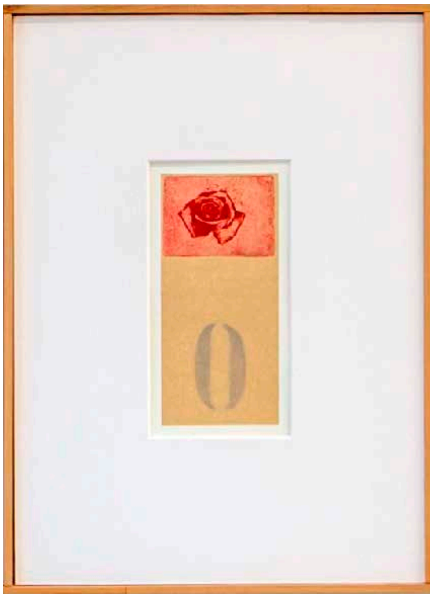
Figura 8. – Omaggio a Pier Paolo Calzolari, Zero Rose (particolare), 2018.