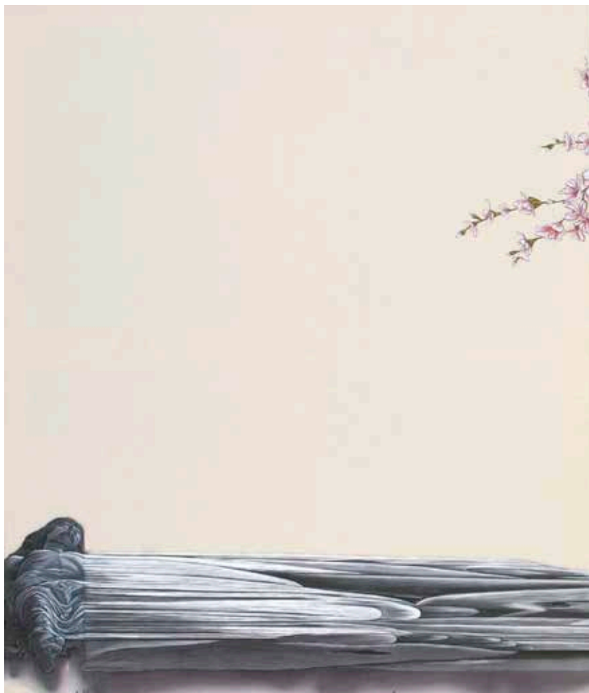
Figura 7. – Visione, dittico (particolare), 2006.