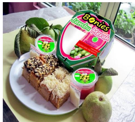
Gambar 1. Puding Jamer