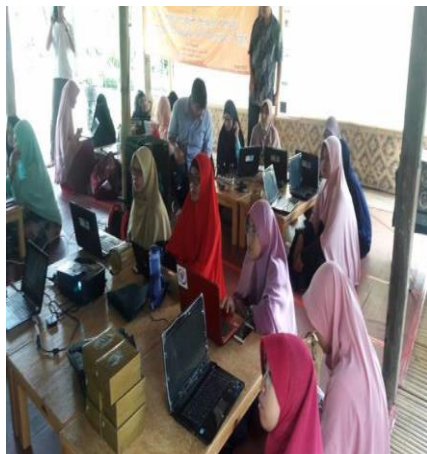
Gambar 1. Pelaksanaan kegiatan membuat website dan gerai on-line