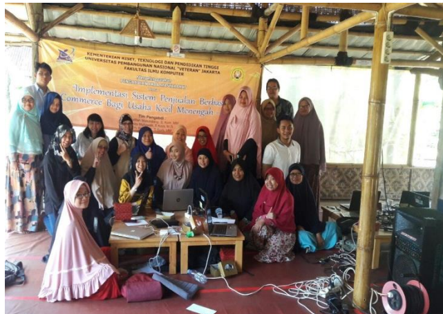
Gambar 2. Foto bersama setelah pelaksanaan kegiatan membuat website dan gerai on-line