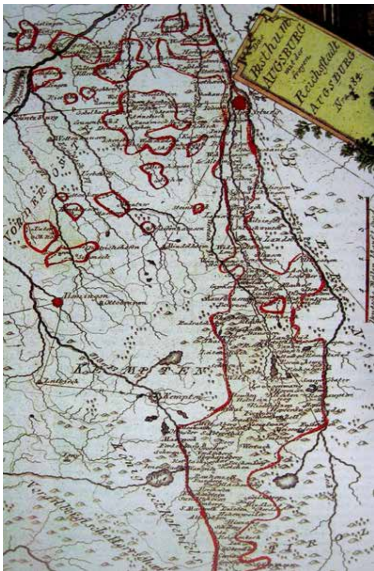
1. Das Hochstift Augsburg 1791, kolorierter Kupferstich nach Franz J. J. Reilly.