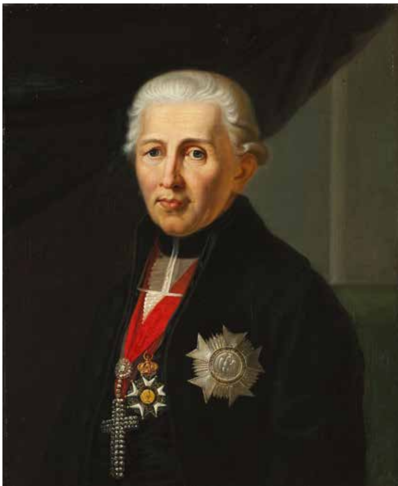
2. Dalberg-Porträt, Ölgemälde von Franz Seraph Stirnbrand, 1812.