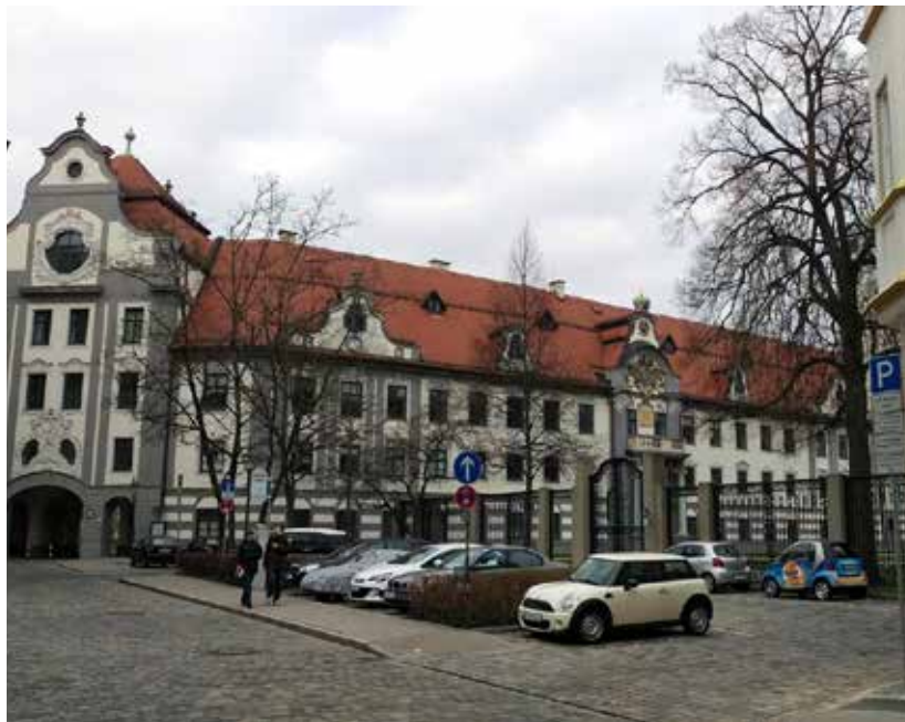
6. Außenbezirk der ehemaligen Augsburger Bischofspfalz, 2016.