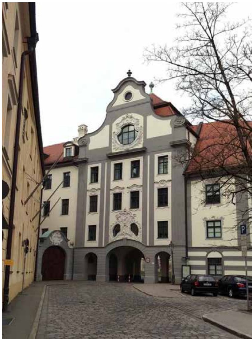
5. Tore zur ehemaligen Augsburger Bischofspfalz, 2016.