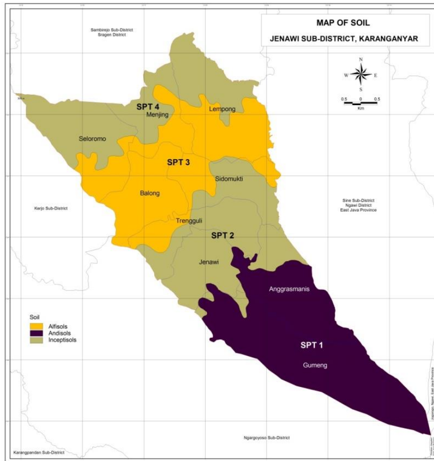
Gambar 1. Satuan Peta Tanah di Kecamatan Jenawi

terdiri dari tuf dan breksi gunungapi, formasi volkan Lahar Lawu (Qlla) terdiri dari komponen andesit dan basal, dan formasi volkan Breksi Jobolarangan (Qvjb) yang terdiri dari breksi gunung api yang bersisipan lava (Sampurna dan Samodra, 1997).