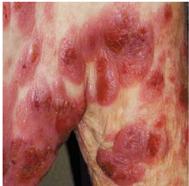
Рис. 1. Диссеминированные изъязвленные опухоли у пациента с грибовидным микозом

К \text{CD}30^+ лимфопролиферативным заболеваниям относятся лимфоматоидный папулез (ЛиП), первичная анапластическая \text{CD}30^+ крупноклеточная лимфома кожи (АКЛК) и переходный тип \text{CD}30^+ ЛПЗ [12].