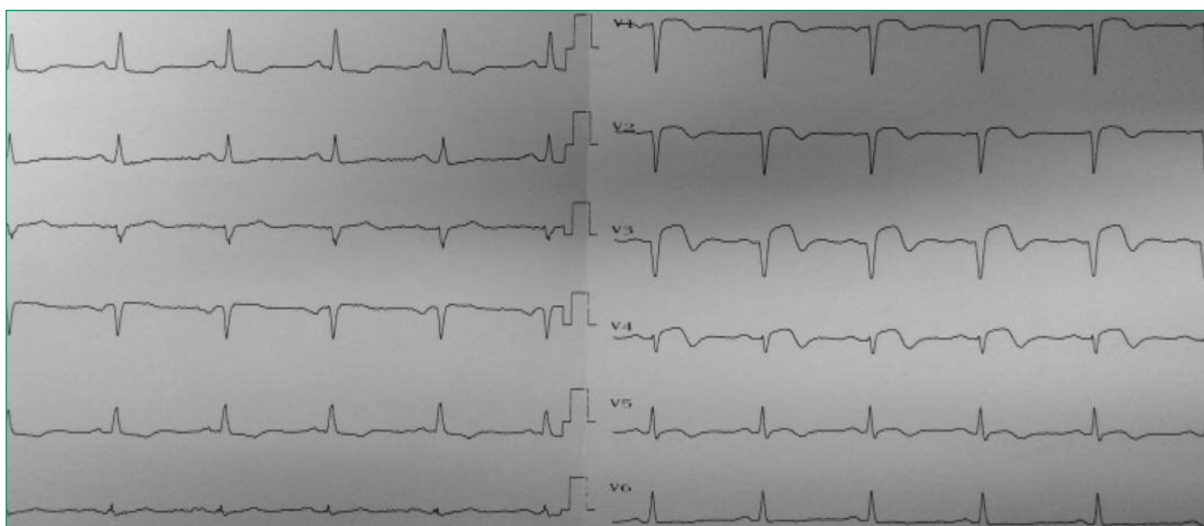
Figure 2. ECG at admission (description in the article)

Рисунок 1. Клиническая картина на момент поступления (A) и через 11 мес после операции (B)