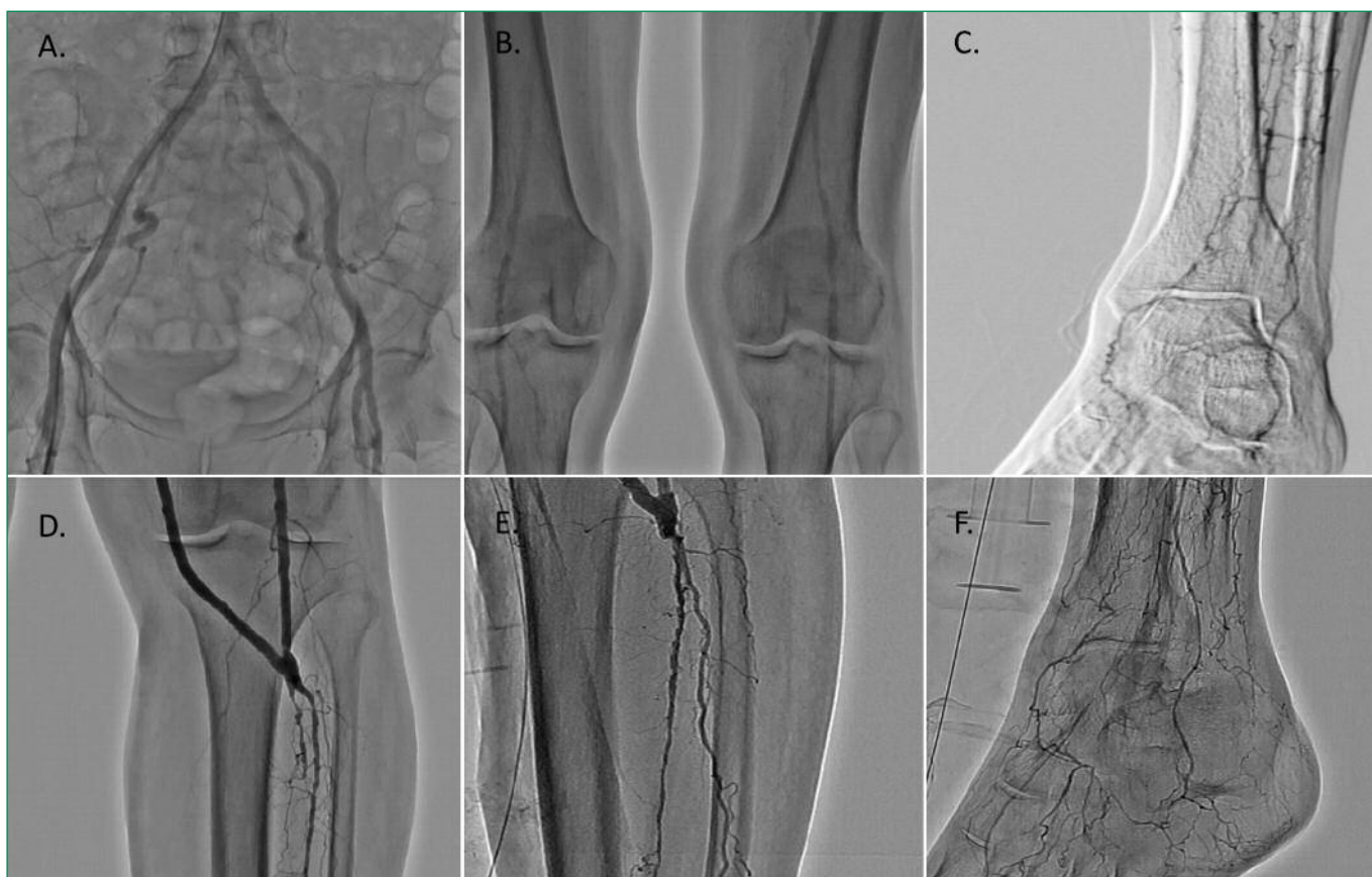
Figure 4. Angiography of the patient's lower limbs

A. Стеноз передней межжелудочковой артерии в средней трети 95%. Окклюзия диагональной артерии. Стеноз огибающей артерии 95%. B. Механическая реканализация, ангиопластика и стентирование диагональной ветви. Ангиопластика и стентирование передней межжелудочковой артерии. Ангиопластика и стентирование огибающей ветви. C. Конечный результат имплантации скаффолдов Absorb