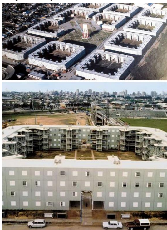
Imagen 1. Conjunto de media densidad de los años 70

Barrio Centenario (Santa Fe), conjunto FONAVI de fines de 1970, diseño por concurso de proyectos, bajo la concepción de mini-ciudad; comprendió 1289 viviendas, plaza, juegos infantiles, capilla, centro de salud, canchas para deportes y tanques de agua para abastecer al barrio. 86.000 m 2 cubiertos construidos con sistemas industrializados. Fuente: http://www.diazdelboyasociados.com/proyectos.php?men1=2&men2=3 .