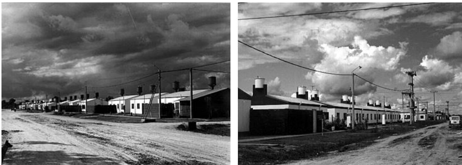
Imagen 2. Barrio de viviendas individuales de los años 90

Conjuntos del sur de la ciudad de Resistencia, operatoria FONAVI de mediados de la década de 1990; grupos pequeños de viviendas, sin equipamientos sociales e infraestructura básica incompleta, construidos con tecnología tradicional. Imágenes propias.