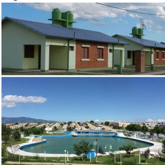
Imagen 4. Barrios de la Política Federal de Vivienda

Arriba: conjunto de 172 viviendas individuales construido por el Programa Techo Digno (2013) en las afueras de la ciudad de Resistencia, a través de un grupo de pequeñas empresas constructoras locales, sin equipamientos sociales e infraestructura básica incompleta.