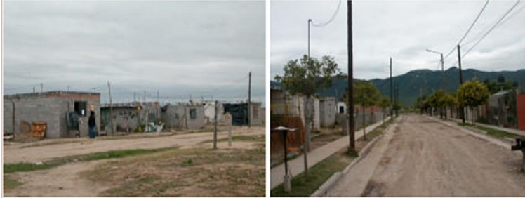
Imagen 3. Intervención del PROMEBA

Barrio Siglo XXI, ciudad de Salta. Intervención del Programa de Mejoramiento de Barrios. Imagen de 1998 sin intervención (Izq.) e imagen posintervención de 2005 (der.).