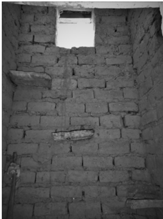
Figura 7. Muro interior de torre campanario. Se observan las piedras empotradas, por donde se asciende para realizar el repique.

El otro volumen, la torre campanario, se asienta sobre un sobrecimiento de mayor dimensión que la base de la torre, tal que este borde que sobresale es empleado como asiento para las actividades que se llevan a cabo en el atrio de la iglesia. Las paredes de la torre campanario conforman una planta de forma cuadrada, alcanzando los 5,50 m de altura, esta misma se encuentra separada a un metro de distancia de la nave única. En el remate se observa un cuerpo piramidal, realizado con hormigón armado, desde donde cuelga un elemento de metal utilizado como campana, y como remate en la parte superior se ancla una cruz de metal.