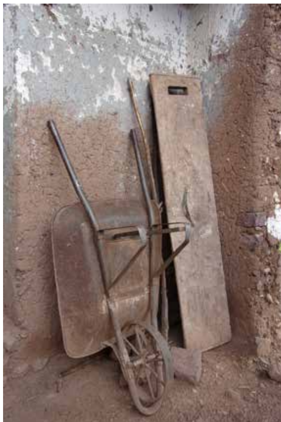
Figura 11. En la fotografía se observan algunas de las herramientas, como la carretilla y un lateral de la tapialera. La perforación que tiene el lateral de la tapialera es donde la tapa se incrusta para ser amarrada por la coyonda.

Los muros tienen un espesor de 0,45 m y una altura de 3,40 m en la parte más alta, y 3 m en la zona baja. Estos muros no tienen cimiento ni sobrecimiento, pero sí se observan algunas piedras aisladas de tamaño considerable en la primera hilada del tapial. Aun así, los muros mantienen un buen estado de conservación sin presentar más daños que el desgaste por el paso del tiempo.