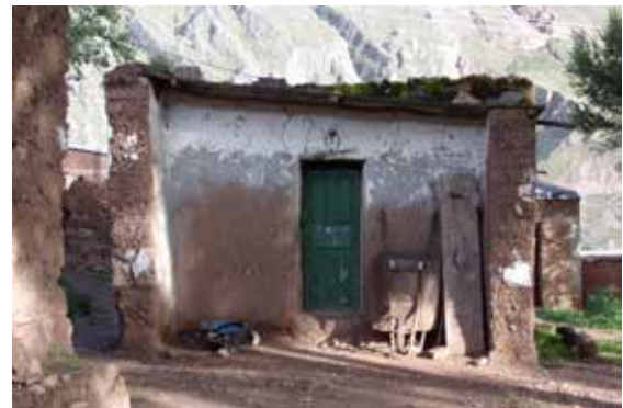
Figura 9. Fachada del oratorio de la familia Ibarra en año 2017.

La casa de los Ibarra está enteramente realizada con la técnica de tapial, tanto los diferentes recintos, entre ellos el oratorio, como el cerco perimetral. En la investigación que venimos realizando esto no es recurrente, debido a que en la actualidad solo se registró el empleo de tapial para la realización de cerramientos de patios, delimitaciones de sembradíos y corrales para animales, es decir construcciones bajas. Otro ejemplo en donde se ha podido observar esta técnica es en la Iglesia del propio pueblo de Nazareno, donde el tapial es de forma trapezoidal, y los muros son de bases anchas que disminuyen a medida que aumentan en altura (Veliz, 2018).