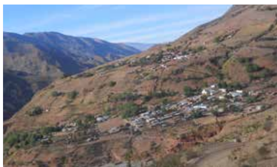
Figura 8. Poblado de Poscaya, año 2017.

El lugar donde se localiza es una ladera de montaña, su organización responde a esta topografía, estructurándose con caminos serpenteantes y casas que se adhieren a la montaña a través del aterramiento del terreno. Se diferencian dos zonas, Campo Rodeo, en la parte elevada, y Poscaya propiamente dicho, en la zona baja. En Campo Rodeo las casas se encuentran dispersas y la mayoría incorpora al domicilio áreas de sembrado y corrales. El barrio de abajo, en cambio, se estructura a partir de una calle central donde las casas se ubican una a la par de la otra, dejando el área de sembrado a las orillas del conglomerado. En el inicio de esta calle principal se ubica la iglesia, y al final del recorrido la cancha de fútbol. El oratorio analizado se ubica en el sector de arriba (Figura 8).