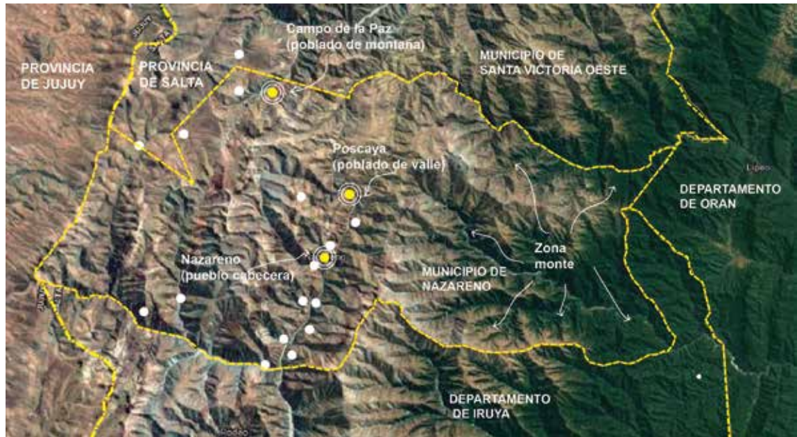
Figura 2. Mapa del Municipio de Nazareno y localización de poblados, año 2020. Elaboración de la autora.

zonas libres de heladas, que colindan con el Parque Nacional Baritú (Piccardo, 2005).