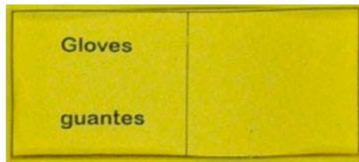
Figura 3. Vocablo con lenguaje técnico en inglés - blanco