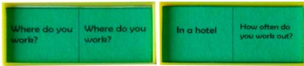
Figura 1. Fichas del domino didáctico

El juego de Dominó tradicional tiene sus /doble-números/, /blanco-números/ y /doble-blanco/. Este contiene en su lugar /doble-preguntas/, /blanco-respuesta/ y /respuesta-respuesta/. El juego puede comenzar con una ficha de /doble-preguntas/ o /respuesta-pregunta/ como se muestra a continuación en la Figura 1.