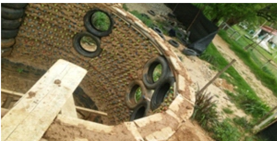
Figura 15. Viga Collarín

Viga collarín de madera: Se ejecutó con residuos de puntales de madera de eucalipto de 3" de diámetro promedio los cuales han sido instalados en la parte superior de los muros en doble hilera horizontal formando parte integrante de los dinteles de todas las puertas y asegurando en los encuentros con los ejes de las columnas. (Figura 15)