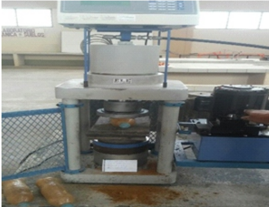
Figura 1. Ensayo de compresión a la botella de agua mineral

Del análisis de diferentes tipos de botellas, se concluyó que las botellas rellenas de tierra son aptas para la construcción por su resistencia y por la gran cantidad disponible. (Figura 1-3)