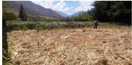
Figura 4. Terreno del módulo de vivienda

Limpieza de terreno: El terreno contenía material de cultivo por lo que se realizó el corte y la limpieza de terreno. (Figura 4)