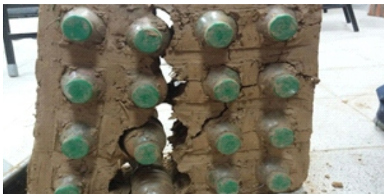
Figura 3. Ensayo de compresión axial a botellas de Sporade

Del estudio de las cimentaciones se concluyo que la capacidad portante del suelo es de 0.89 kg/cm 2 , el cual es muy bajo para cimentaciones, por lo que se colocó 3 filas de llantas aro 16 rellenos con material compactado de tierra.