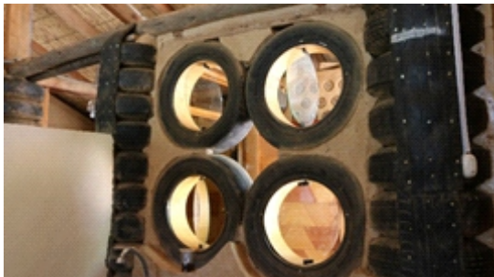
Figura 21. Ventanas

Ventanas: Las ventanas son de neumáticos de aro 16 con marcos de triplay de 4mm y vidrios semidoble redondas sujetadas con pívot y son rebatibles. (Figura 21)