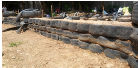
Figura 12. Estabilización de sobrecimiento con fajas de neumáticos

Sobrecimentación con neumáticos de diámetro 26cm (neumáticos de trimoviles Bajaj): Se realizó con neumáticos de diámetro de 26 cm., colocados en tres (3) hileras horizontales, solo en los muros, para lograr la estabilidad óptima del sobrecimiento se colocó fajas de los neumáticos con tornillos de sujeción en todo el perímetro y en todas las hileras. (Figura 12)