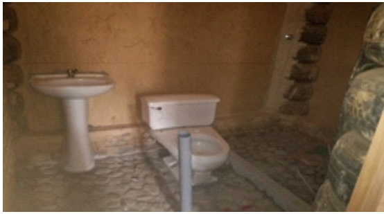
Figura 26. Instalaciones sanitarias

inodoro y lavatorio de residuos de otra obra de la UNHEVAL. (Figura 26)