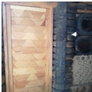
Figura 22. Puerta

Puertas: Son de residuos de madera, especialmente en los apanelados pegados escopleados y lijados para el acabado final con chapas de seguridad de tres golpes y de las puertas interiores con chapas de bola. (Figura22)