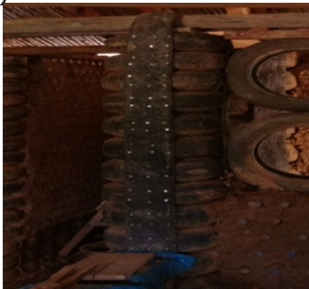
Figura 14. Columnas con neumáticos

Columnas: Las columnas son de neumáticos de aro 16, que fueron instalados desde la cimentación, para la estabilidad vertical se colocó puntales de madera seca de eucalipto en el eje central hasta la altura del encuentro de la viga collarín de madera, asimismo con fajas del neumático estirado se aseguró de manera vertical y entornillado en tres partes. (Figura 14)