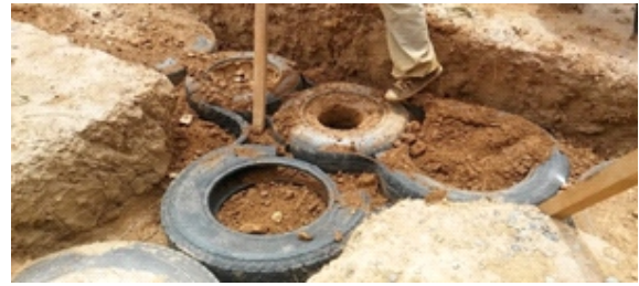
Figura 10. Estabilizando la cimentación con faja de neumáticos