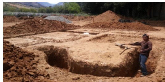
Figura 6. Excavación de zanja

Excavación de la cimentación: Se realizó la excavación de la zanja con una profundidad de 1m con un ancho de 0.5 m en toda la base de los muros. (Figura 6)