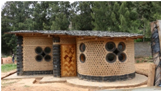
Figura 27. Módulo de vivienda