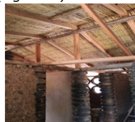
Figura 19. Cielorraso

Cielorraso: Se ha realizado con carrizo debidamente sujetado en las correas de madera con soguillas de cabuya, rafia y de nylon. (Figura 19)