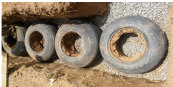
Figura 9. Cimentación con neumáticos de aro 16

Cimentación con neumáticos aro 16: Se realizó la cimentación sobre la cama de piedra chancada con neumáticos de aro 16, en tres (3) hileras horizontales, debidamente rellenas con tierra previa compactación, los cuales fueron colocados de manera intercaladas manteniendo los neumáticos para lograr la estabilidad óptima de la cimentación se colocó fajas de los neumáticos con tornillos de sujeción, a un solo eje en las esquinas a fin de preparar y tener como columna de amarre. Concluida la colocación se realizó el llenado de más tierra en los espacios vacíos debidamente compactada hasta el nivel de terreno. (Figura 9-11)