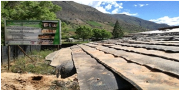
Figura 20. Cobertura

Cobertura: Encima de los carrizos se colocó la torta de barro a nivel de las correas logrando uniformidad en cuanto a la inclinación del techo; se ubicó encima de la torta de barro seco hule de plástico para evitar las filtraciones de agua por el techo por las inclemencias del tiempo; además se puso fajas de neumáticos extendidos de manera paralela a las correas sobre el cual se sujeta con tornillos de 2" a cada 10 cm con un traslape de 2" en el sentido de evacuación de las aguas pluviales. (Figura 20)