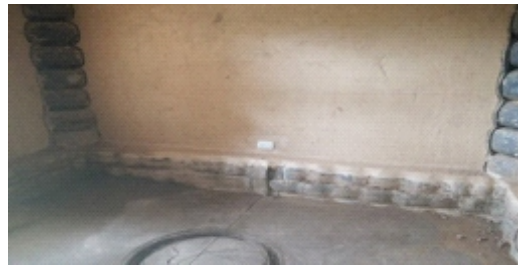
Figura 23. piso

Piso: Después de una nivelación total de todos los ambientes se realizó una mezcla de cemento y tierra en una proporción de 1:3 y se vació en el piso de los ambientes siendo el acabado final liso y con bruñas. Los servicios higiénicos se construyeron con lajas de piedras y cemento debidamente nivelado. (Figura 23)