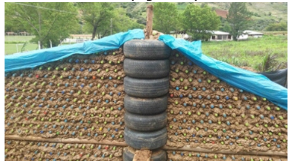
Figura 17. Cumbreras

Cumbreras de madera: La cumbrera es de una sola pieza de madera rolliza de eucalipto con un diámetro promedio de 6" (15 cm) de extremo a extremo. (Figura 17)