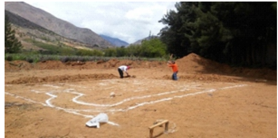
Figura 5. Señalización del ancho de excavación de la zanja

Trazo y replanteo: Se realizó en el terreno la colocación de balizas de madera para ubicar los ejes de construcción y con el yeso se señaló el ancho de excavación de zanjas. (Figura 5)