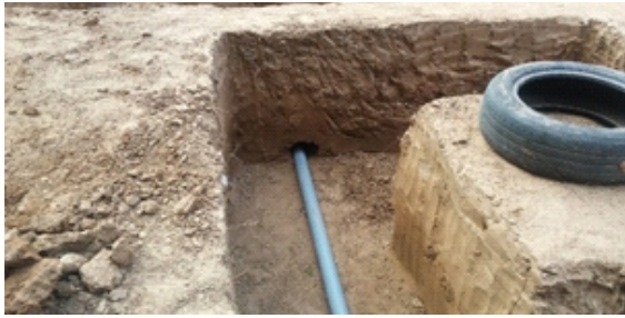
Figura 7. Tubería enterrada

entre 10 y 15 cm para la evacuación pluvial adecuada y óptima de toda la cimentación de los muros. (Figura 7-8)