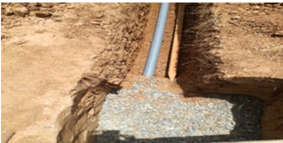
Figura 8. Cama de piedra chancada

Cimentación con neumáticos aro 16: Se realizó la cimentación sobre la cama de piedra chancada con neumáticos de aro 16, en tres (3) hileras horizontales, debidamente rellenas con tierra previa compactación, los cuales fueron colocados de manera intercaladas manteniendo los neumáticos para lograr la estabilidad óptima de la cimentación se colocó fajas de los neumáticos con tornillos de sujeción, a un solo eje en las esquinas a fin de preparar y tener como columna de amarre. Concluida la colocación se realizó el llenado de más tierra en los espacios vacíos debidamente compactada hasta el nivel de terreno. (Figura 9-11)