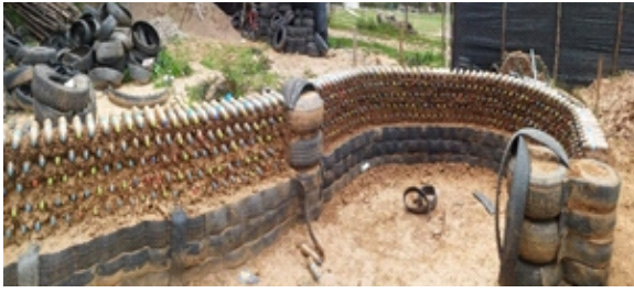
Figura 13. Muros con botellas pet

Columnas: Las columnas son de neumáticos de aro 16, que fueron instalados desde la cimentación, para la estabilidad vertical se colocó puntales de madera seca de eucalipto en el eje central hasta la altura del encuentro de la viga collarín de madera, asimismo con fajas del neumático estirado se aseguró de manera vertical y entornillado en tres partes. (Figura 14)