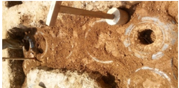
Figura 11. Rellenado de espacios con tierra

Sobrecimentación con neumáticos de diámetro 26cm (neumáticos de trimoviles Bajaj): Se realizó con neumáticos de diámetro de 26 cm., colocados en tres (3) hileras horizontales, solo en los muros, para lograr la estabilidad óptima del sobrecimiento se colocó fajas de los neumáticos con tornillos de sujeción en todo el perímetro y en todas las hileras. (Figura 12)