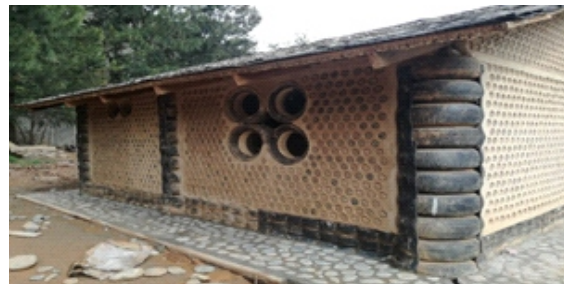
Figura 24. veredas

Veredas: Se realizó con emboquillado de piedras de canto rodado en un ancho de 70 cm, con pendiente hacia el exterior del 1% para la evacuación de las aguas pluviales en todo el perímetro del módulo de vivienda. (Figura 24)