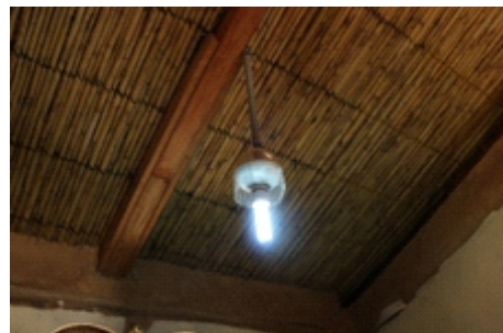
Figura 25. instalaciones eléctricas

Instalaciones eléctricas: Todo el circuito del sistema de electricidad fue instalado los cables dentro de tubos de 3/4" PVC-SEL tanto para los centros de luz, tomacorrientes y los interruptores. (Figura 25)