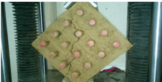
Figura 2. Ensayo compresión axial a botellas de Coca cola