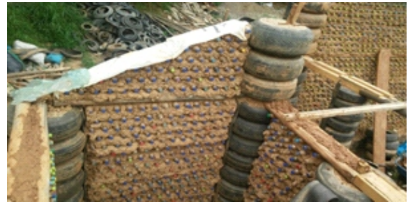
Figura 16. Los tímpanos

Los tímpanos: Fue ejecutado en la parte central con columnas de neumáticos aro 16 y el resto de muros con barro pastoso y botellas pet de agua mineral con las mismas características técnicas de los muros y columnas. (Figura 16)