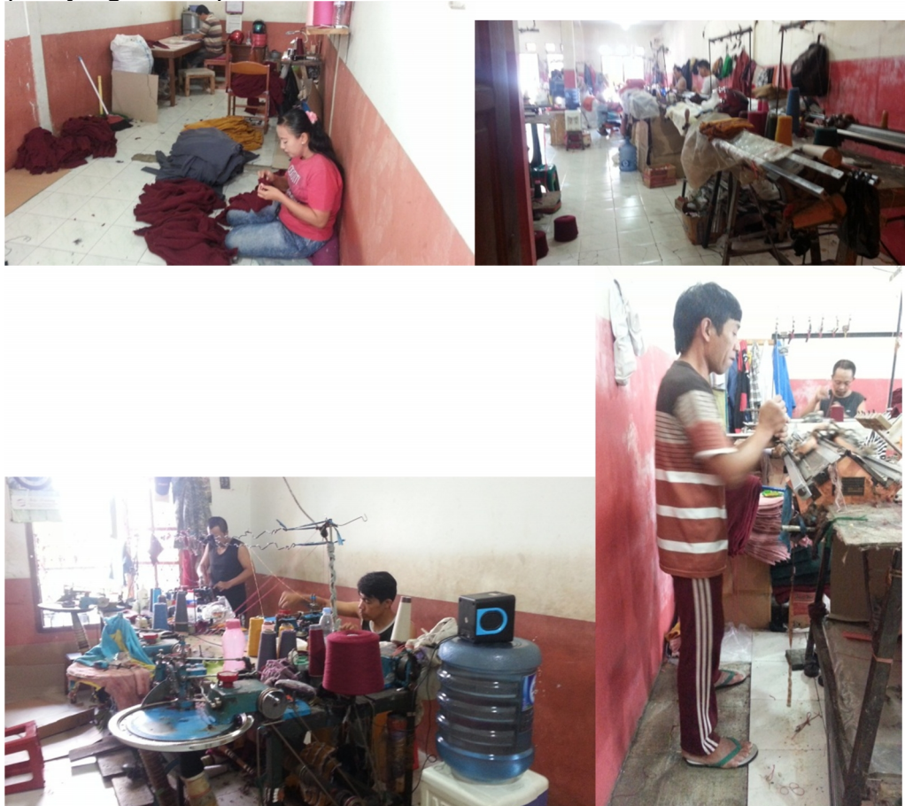
Gambar 1. Kondisi kerja di salah satu sentra produksi

Sebagian besar pekerja berusia sekitar 40 tahun ke atas, dengan 70% nya adalah pekerja laki-laki. Dari pengamatan awal pada beberapa tempat produksi didapati kondisi kerja seperti yang terlihat pada Gambar 1.