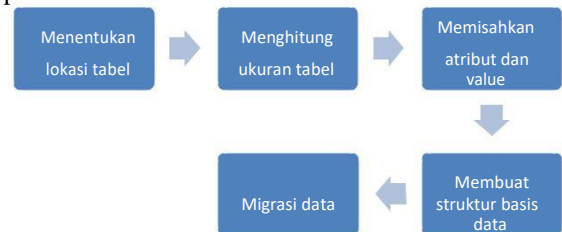
Gambar 2. Tahapan Ekstraksi Tabel

Dari pemisahan kedua bagian ini, dapat ditentukan apakah tabel berbentuk column-row wise atau bukan. Tabel dengan bentuk ini dikenali dari indeks atribut yang dikenali. Jika atribut yang dikenali terdapat pada baris pertama dan kolom pertama maka tabel berbentuk column-row wise .