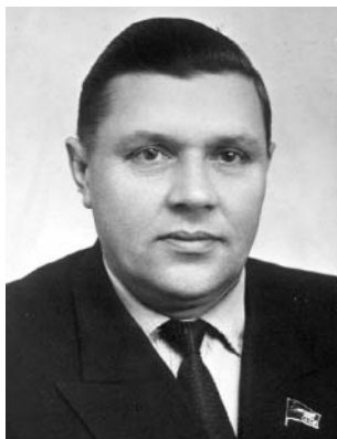
Профессор Н.Е. Ярыгин (1917–2004)