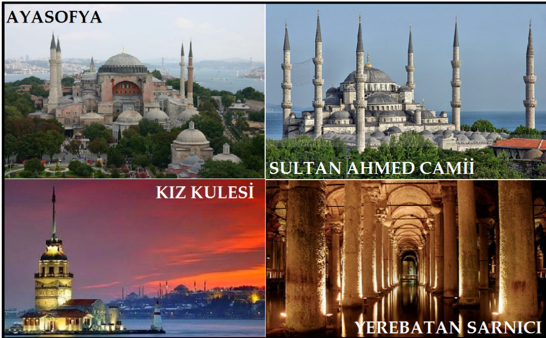
Şekil 2: İstanbul'un Somut Kültürel Miras Unsurları

İmparatorlukların başkenti İstanbul ; Aya Sofya, Sultan Ahmet Meydanı, Sultan Ahmet Camii, Topkapı Sarayı, Kız Kulesi, Yerebatan Sarnıcı, Süleymaniye Külliyesi ve Camii, Hırka-i Şerif Camii, Eyüp Sultan, Galata Kulesi, Beyazıt Kulesi, Dikilitaş, Çemberlitaş, Mısır Çarşısı, Kapalı Çarşı, Sarayları ve Surları ile tarih boyunca çok sayıda medeniyete ve kültüre ev sahipliği yapmış dünya çapında bir destinasyonudur (Şekil 2).