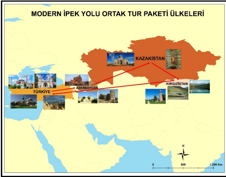
Şekil 1: Modern İpek Yolu Ortak Tur Paketi Kapsamındaki Ülkeler

Türk Dili Konuşan Ülkeler İşbirliği Konseyi (Türk Konseyi)’nin 2013 yılında aldığı bir karar ile Türkiye - Azerbaycan - Kazakistan - Kırgızistan arasında uygulamaya konulan “ Modern İpek Yolu Ortak Tur Paketi ” adlı proje, Türk Dünyası’nın tanınması, reklamı ve imajının uluslararası düzeyde tanıtılmasında önemli rol oynayacaktır. Proje kapsamında gerekli çalışmalar tamamlanmış ve ilk tur 15 Mart 2018 tarihinde gerçekleştirilmiştir. “Grand Paket” adı ile de anılan tur şu anda Türkiye - Azerbaycan - Kazakistan - Kırgızistan’ı kapsamaktadır (Şekil 1). Modern İpek Yolu Ortak Tur Paketi kapsamına kısa sürede Özbekistan ve Türkmenistan da katılmalıdır. Böylece Türk Dünyası’nın tamamının tanıtımının sağlanması gerçekleştirilmelidir. Aksi durumda Semerkand, Buhara, Hive gibi tarihi yerleşmelere ev sahipliği yapan Özbekistan’sız ve Aşkabat’ı barındıran Türkmenistan’sız Ortak Tur Paketi eksik kalmış olacaktır.