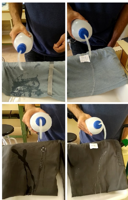
Figura 2: Probando a mojar los textiles sin impregnar e impregnados en aerosol.

La S1 comienza con la presentación (E0) de la actividad en la que se informa al alumnado sobre la metodología de indagación guiada que van a seguir y los objetivos de esta propuesta. Seguidamente (E1), se muestra un vídeo donde el docente añade un aerosol a distintos textiles. Esto se hace mediante un vídeo, ya que una vez aplicado el aerosol, hay que esperar cierto tiempo para lograr el efecto deseado, por lo que no es posible hacerlo en la propia sesión, sino que hay que hacerlo previamente. A continuación, el profesor vierte agua y ketchup a los mismos textiles que aparecen en el video, con y sin aerosol para poder observar las diferencias (ver Figura 2).