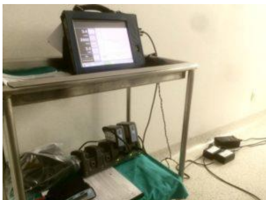
Imagen 1. Monitor con pantalla táctil (arriba), con adaptadores para corriente alterna y transmisión al dispositivo. Unidad microprocesadora portátil y cargador de baterías (abajo). HDAV en Hospital Universitario y Politécnico La Fe.

Entre los componentes del dispositivo se encuentran el controlador (unidad microprocesadora que llevará el paciente junto con dos baterías, la segunda de reserva), un monitor táctil de mayor tamaño para su manejo en el periodo postoperatorio y un cargador de baterías.