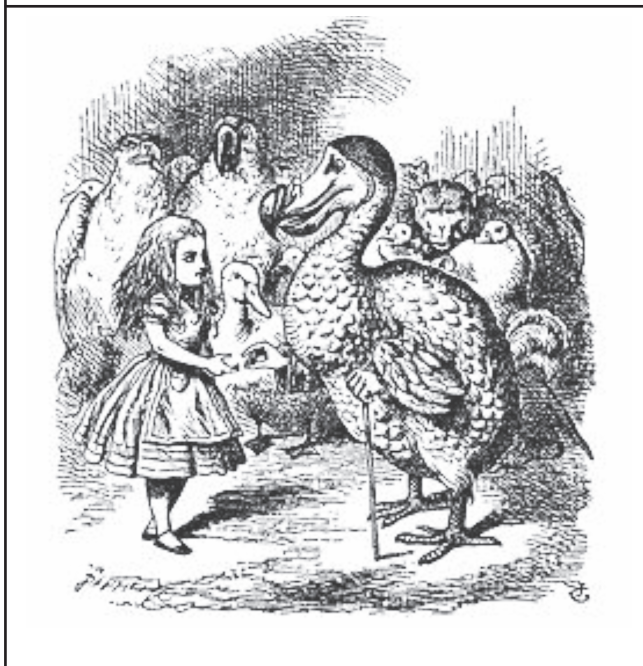
FIGURA 1 LEWIS CARROLL (1865): AVENTURAS DE ALICIA EN EL PAÍS DE LAS MARAVILLAS (CAPÍTULO 3)

El problema ya no sería tanto la eficacia como la eficiencia y el coste-beneficio. A este respecto, resulta tan prometedor como desconcertante ver que terapias aparentemente simples y a la vez diferentes entre sí no son sin embargo menos eficaces que la terapia cognitivo-conductual. Se refiere a la activación conductual (Finning et al, 2017; Richard et al, 2016) y un asesoramiento genérico (“generic counseling”, Pybis, Saxon, Hill y Barkham, 2017). No se trata de cuestionar la terapia cognitivo-conductual (cuyo mérito es indiscutible), sino de abrir la cuestión acerca de la naturaleza de este fenómeno: cómo es que existen diferentes psicoterapias, algunas más sencillas que otras, que son similares en eficacia. La práctica basada en la evidencia no parece que haya resuelto el problema.