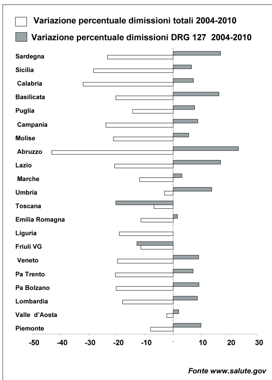
Figura 3. - Variazione percentuale delle ospedalizzazioni totali e dei ricoveri per scompenso cardiaco fra il 2004 e il 2010.

Dalle risposte emergono alcuni aspetti che giustificano lo sforzo compiuto in questi anni dall'ANMCO e dalle altre società scientifiche e che rafforzano le motivazioni a continuare a percorrere questa strada. In particolare l'ANMCO emerge come interlocutore tecnico per la maggior parte delle istituzioni regionali e il Documento di Consenso è in linea di massima un modello organizzativo ritenuto utile per la costruzione delle reti assistenziali.