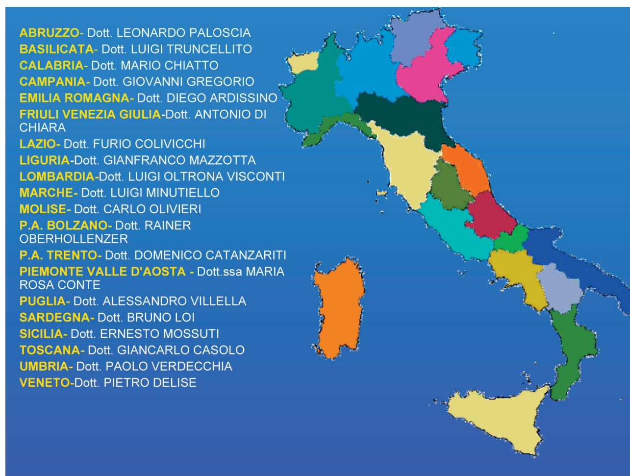
Figura 2. - Elenco nominativi presidenti regionali ANMCO.

Basilicata: nel marzo 2007 è stata istituita con delibera regionale la rete denominata "Rete integrata Ospedale-Territorio per la gestione dello SC" che è coordinata, per incarico del Dipartimento Salute, da un rappresentante dell'ANMCO. È inoltre attivo un Gruppo di lavoro e coordinamento composto da specialisti dedicati, funzionari regionali, Medici di Medicina Generale (MMG). Presso le Aziende Sanitarie della regione sono insediati comitati tecnici composti secondo i criteri previsti dalla Consensus. A Matera e a Potenza sono attive due Unità Operative semplici dipartimentali per lo SC e vi sono sul territorio altri quattro ambulatori dedicati. Tutte queste strutture operano in collaborazione con i MMG, con i medici del territorio e delle cure domiciliari secondo un protocollo attuativo che recepisce i contenuti del Documento di Consenso. Si può quindi affermare che il concetto della rete per lo SC in questa regione è una realtà già operativa, i percorsi costituiscono obiettivo strategico per i Direttori Generali delle Aziende e sono lo scopo prioritario del nuovo Piano Sanitario Regionale, la cui approvazione è prevista entro il 2011. Il Documento di Consenso, rielaborato per adattarlo alla realtà regionale è stato utilizzato per la realizzazione della rete regionale e i suoi contenuti sono stati di recente proposti per la costruzione di una rete provinciale. A partire dal 2005 in varie sedi della regione sono stati