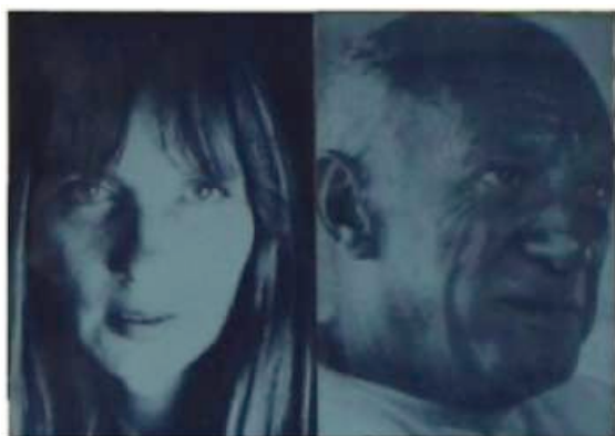
Fig. 3 - Jandira Lorenz e Picasso