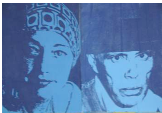
Fig. 19 - Doraci Girrulat e Josef Beuys