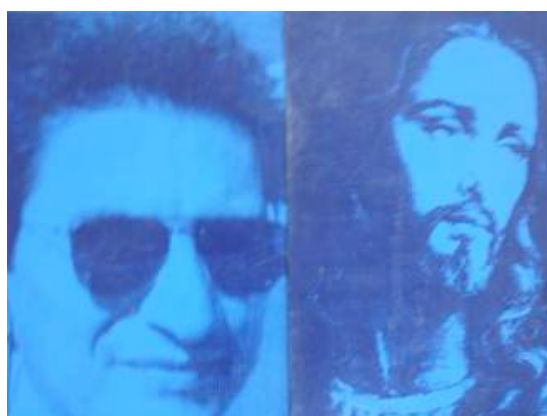
Fig. 21 - Estevão Roberto Ribeiro e Jesus Cristo