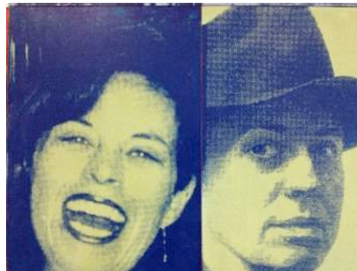
Fig. 4 - Sandra Makowiecky e Edward Hopper