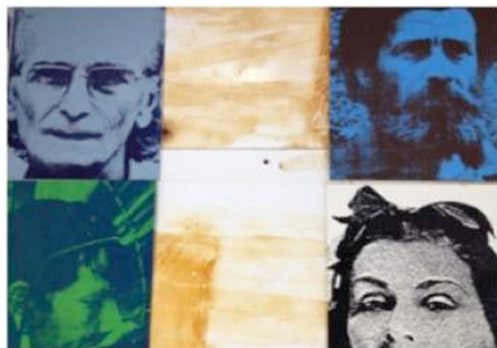
Fig.35 - Partes deterioradas do painel, com placas faltantes.