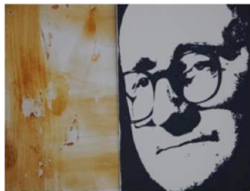
Fig.36 - Partes deterioradas do painel, com placas faltantes.