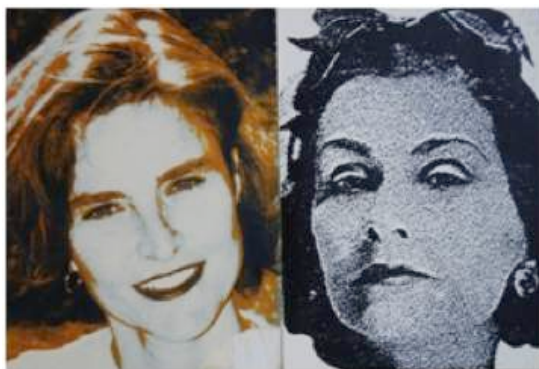
Fig. 29 - Maria Isabel Da Costa e Coco Chanel