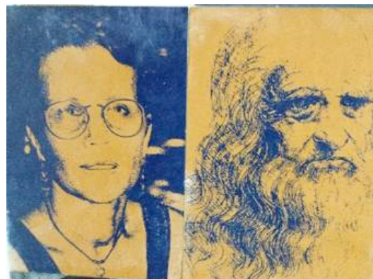
Fig. 6 - Albertina Medeiros e Leonardo da Vinci