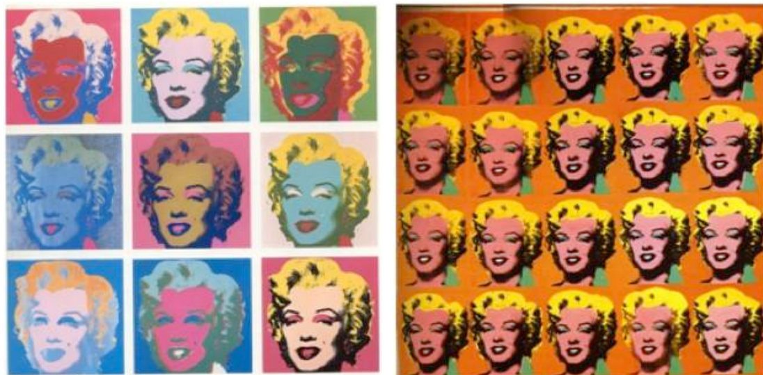
Fig. 35 - Andy Warhol. Marilyn, serigrafia, s.n., 1964 9