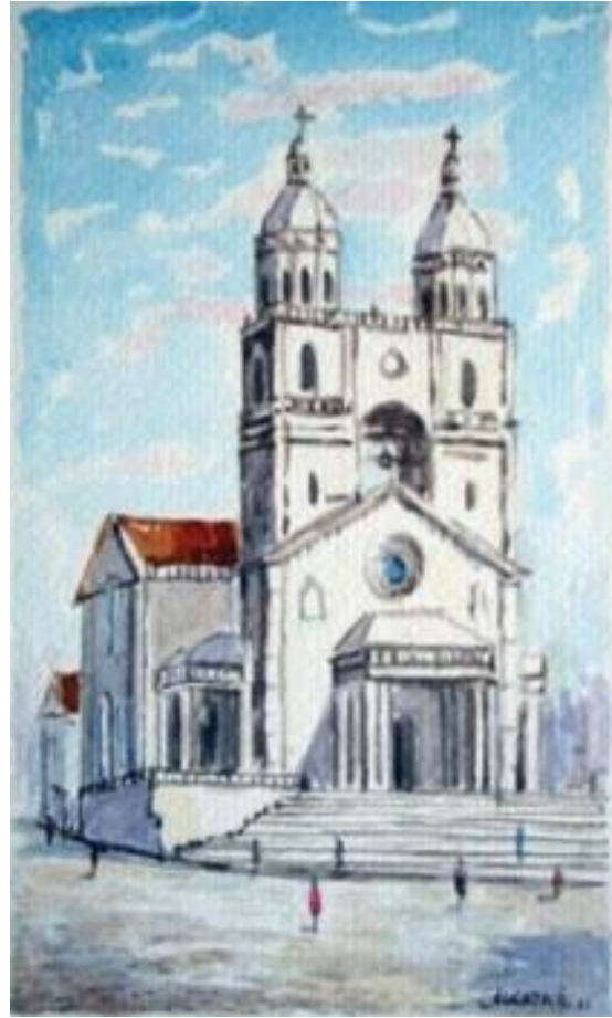
Figura 12 - Aldo Beck. Catedral Metropolitana. s/d. Aquarela. 12x 21 cm. Coleção Marcos Fiúza.

Sabemos que o trabalho da memória, que é seletiva, não há de se esgotar na recuperação do passado, mas deve apontar para um desejo de futuro. Essa terrível responsabilidade foi depositada na arte. As artes seriam capazes, como outrora, de dizer o indizível, de representar o irrepresentável. Onde, finalmente, localizar a memória? Pode uma obra de arte ser datada? Como determinadas condições culturais acabam por relegar muitas obras para uma condição de abandono e esquecimento, desconhecimento e apagamento? Se cultura é a regra e arte, a exceção, como nos diz Godard, como aceitar que critérios culturais determinem o que deve ou não ser considerado moderno ou contemporâneo? Haveria algo tão ou mais moderno/contemporâneo hoje do que o sentimento de pertença a uma cidade? Ao prestarmos mais atenção a uma história das sensibilidades, destacamos as obras de Aldo Beck, um