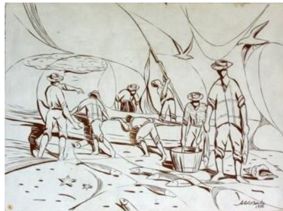
Figura 5 - Aldo Beck. Pescadores. 1970. Pintura e entalhe sobre madeira pintada. {s.n}. Acervo Artur Beck Neto.

Neste período, apesar de vigorar, como vimos anteriormente no Brasil, nos centros irradiadores de cultura, uma adoção do abstracionismo, aqui, independente dos grupos citados, o abstracionismo, enquanto paradigma não ganha terreno e as imagens continuam sendo figurativas, mesmo que possam ser vistas como abstrações do referente porque se recusam a uma representação do meio circundante. O que os críticos mais se reportavam ao que não consideravam moderno, era a ausência de sentimentos, “pois não é o objetivismo de tema que importa e sim, o subjetivismo do próprio artista, a realização livre e imediata de seu sentimento, da sua fantasia inventiva, da sua maneira de ser, perante o mundo em que vive” (AQUINO, 1950). Todavia, como não ver traços do modernismo no trabalho “ Pescadores” (fig.5).