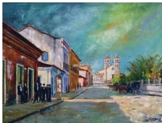
Figura 3 - Aldo Beck. Praça XV. 1970. Óleo sobre tela. 79 x 59 cm. Acervo Artur Beck Neto.

Parece ser esta a cara moderna em Florianópolis. Voltar-se para a sua vida, o seu dia a dia. Falar de temas tão corriqueiros como o vento sul que incomoda tanta gente e que por