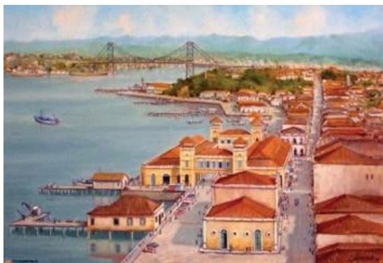
Figura 1 - Aldo Beck. Antiga Florianópolis. 1983. Vista da Cidade. Parte Sul. Óleo sobre tela. 38 x 53 cm. Acervo Artur Beck Neto.

Estes artistas buscavam estabelecer os contornos de uma imagem local, tal como fizeram os modernistas de 22, buscando uma imagem brasileira. Ao eleger estes artistas, eles tiraram o foco de Victor Meirelles e a idéia de construção de um Brasil, baseada em grandes personagens e fatos históricos, símbolo máximo da arte acadêmica que neste momento, não interessava aos jovens artistas.