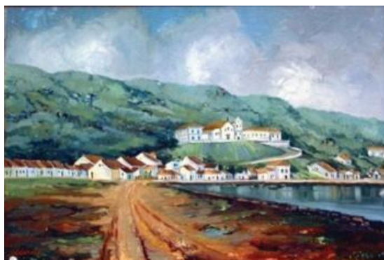
Figura 4 - Aldo Beck. Hospital de Caridade. 1970. 40,5 x 62 cm. Antiga Florianópolis. A colina do Menino Deus e o começo do Bairro da Toca. Reconstituição de fins do século XIX. Óleo sobre tela -. Acervo Artur Beck Neto.