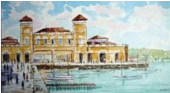
Figura 7 - Aldo Beck. Mercado Público. 1991. 20 x 38c m. Aquarela. Coleção Marcos Fiúza.