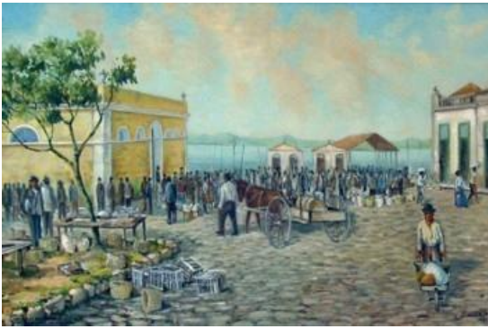
Figura 6 - Aldo Beck- Antiga Florianópolis. 1984. Óleo sobre tela. 40 x 60 cm. Reconstituição de 1878. Praça lateral do Mercado Antigo, de 1851. Acervo Artur Beck Neto.