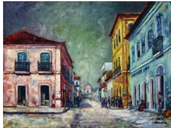
Figura 9 - Aldo Beck-Vista da cidade. 1970. Óleo sobre tela. 79 x 59 cm. Reconstituição. Coleção Artur Beck Neto.

Sou de opinião que em benefício dos modernismos o antigo não deveria ser inteiramente sacrificado. Uma boa parte da cidade deveria ser poupada. Eu ando por aí desenhando tudo com muita fúria, com medo de que no dia seguinte aquilo tenha desabado. Eu chego a me sentir um pouco responsável pela memória das coisas. É a parte que me cabe. Trabalho em cima do que ainda resta. (BECK, 1986).