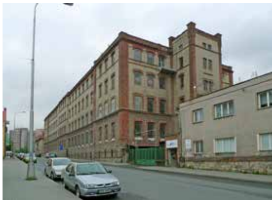
Obr. 2: Frydek-Místek, přádelna bavlny firmy A. Landberger, průčelí při ulici Nádražní v pohledu od železniční stanice. Foto Michaela Ryšková, 2013.