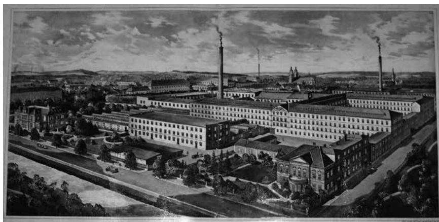
Obr. 4: Krnov, továrna na sukna firmy A. Larisch, firemní veduta. Muzeum města Krnov.