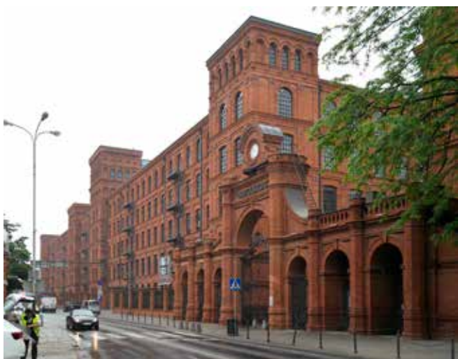
Obr. 5: Lodž, přádelna bavlny Israel Poznański / Vienna House Hotel Lodž, uliční průčelí. Foto Michaela Ryšková, 2018.