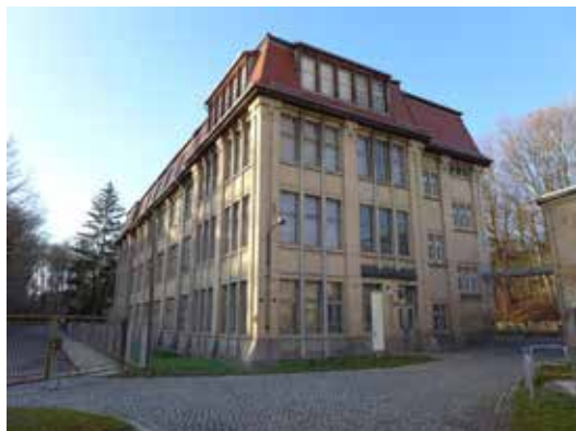
Obr. 3: Crimmitschau, továrna na sukna Gebrüder Pfau. Areál, jehož provoz skončil v roce 1990, je přístupný veřejnosti. Stroje jsou udržovány v provozuschopném stavu. Prostředí si uchovává genia loci průmyslového provozu.